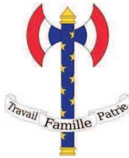
Figure 5 1 : La Francisque stylisée, qui emprunte autant à l'arme des Francs qu'aux faisceaux des lecteurs

également dans ces mots les protestations de Maurice Barrès face aux théories des intellectuels dreyfusards à propos de la nationalité, auxquelles il préférait la réalité matérielle représentée par la terre et les morts. La Révolution nationale remonte jusqu'aux premiers Francs pour définir un temps et un espace qui lui paraissent à même de réellement structurer l'âme française. L'adoption de la francisque, à la fois comme emblème de l'Etat français et comme décoration officielle du Régime de Vichy, témoigne de ce regard tourné vers le passé.