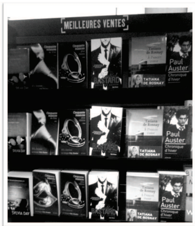
Présentoir d'une librairie FNAC, mai 2013 : les Fifty Shades et Beautiful Bastard en tête de gondole 9

Partir d'exemples à la Fifty Shades of Grey , c'est-à-dire de cas très récents où des amateurs ont réussi à passer du côté de l'édition officielle et commerciale – le « côté obscur » diront peut-être certains fans –, pour essayer d'expliquer les rouages des fanfictions, reste cependant problématique : ils demeurent des exceptions, pouvant donner une image biaisée du contenu de l'ensemble des textes et surtout niveler les processus et les interactions qui accompagnent leur mise en ligne initiale. Ainsi, bien qu'une partie des médias français, plutôt en presse écrite qu'à la télévision d'ailleurs, aient fait l'effort d'évoquer le passé de fanfiction de Cinquante nuances de Grey , rares sont les critiques à avoir relié la répétitivité du style ou des scènes de sexe aux contraintes de la publication par épisode sur Internet. De plus, si cette forme d'appropriation textuelle semble plus que jamais s'épanouir sur le Web, elle n'est pas née avec le nouveau média : dès le tournant des années 1960-1970, l'expression « fan fiction » est utilisée aux États-Unis pour désigner ce type de texte, avec l'apparition dans les fanzines –