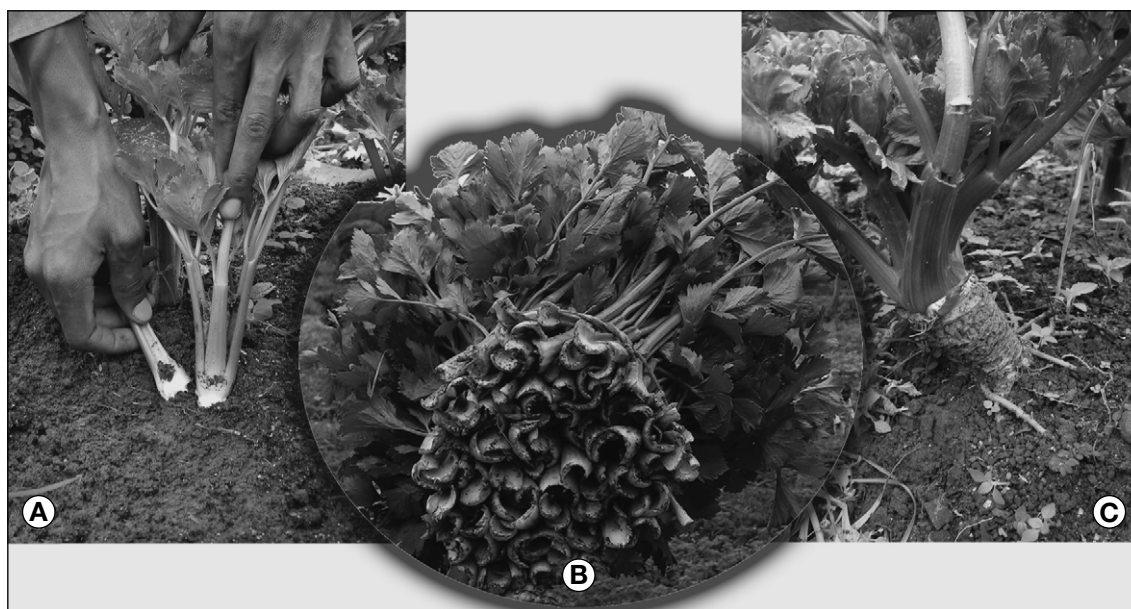
Figure 1. Récolte traditionnelle du céleri branche dans le bas-fond de Nkolondom (Yaoundé).

Aux dires des producteurs, la pourriture molle touchait auparavant moins de 5 % des plants d'une parcelle mais, depuis trois ans, elle détruit plus de la moitié des plants en quelques mois. De ce fait, la durée du cycle cultural est passée de 7 à 4-5 mois. Les pourritures observées ont d'abord été attribuées à des carences en bore ou en calcium, auxquelles le céleri branche est sensible (Bouzo et al. , 2007). Or, en 2007, les analyses de sols qui ont été faites pour tester cette première hypothèse, ont révélé des teneurs moyennes de 2,5 meq/100 g de calcium et de 2,9 mg/kg de bore, supérieures aux seuils de carence, respectivement de 1,5 meq/100 g et 2 mg/kg. Dans le même temps, les analyses microbiologiques de plants présentant les premiers