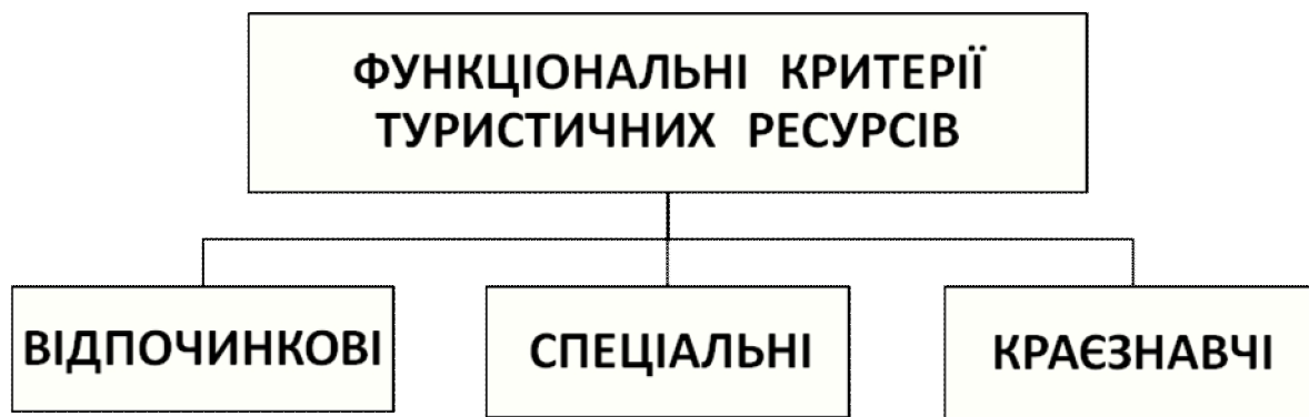
Рис. 1. Функціональні критерії туристичних ресурсів (складений автором)

- краєзнавчі ресурси, які є предметом пізнавального інтересу[6].