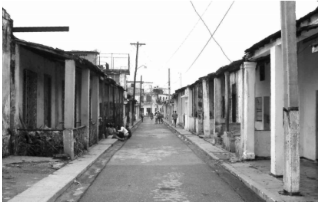
FIG. 1: UN PASAJE CON VIVIENDAS EN EL AÑO 2000, LAS QUE MANTIENEN LOS RASGOS DEL DISEÑO ORIGINAL

El 30 de Octubre de 1910 se colocó la primera piedra del poblado. El primer bloque de 100 casas quedó terminado en Febrero de 1911, haciéndose después entregas parciales hasta completar 900 casas en Agosto de 1912, para llegar a 950 unidades más adelante. En Enero de 1911 se efectuó el sorteo de las primeras 100 casas. El último sorteo tuvo lugar en Marzo de 1943. De las 950 viviendas construidas y sorteadas en Pogolotti, 928 familias tomaron posesión de igual número de casas. De las 22 restantes 6 se dieron a la Secretaría de Instrucción Pública para