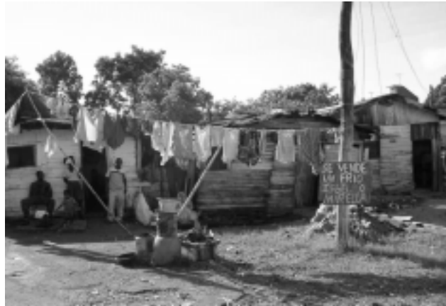
FIG. 4:ASENTAMIENTO ISLA DEL POLVO