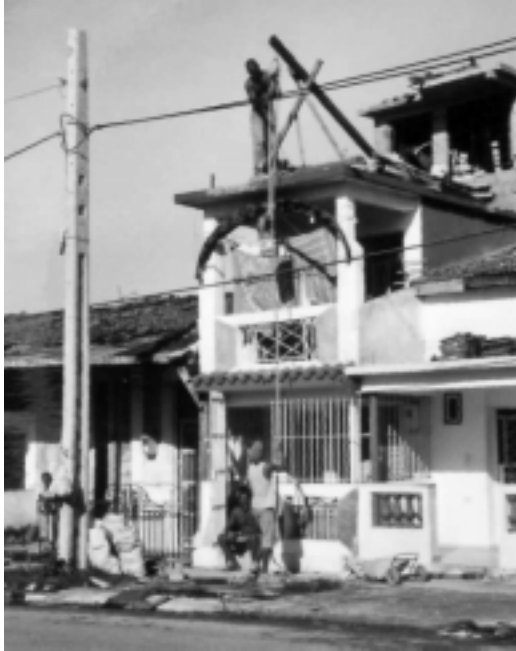
FIJ.3: VIVIENDA EN EL CONJUNTO ORIGINAL A LA QUE SE LE ESTÁ AGREGANDO UN PISO POR AUTO-CONSTRUCCIÓN

las esquinas se ubican almacenes. Hay también algunas construcciones modernas de dos o tres pisos que sirven de oficinas públicas, consultorios médicos y también como viviendas privadas. Algunos de los edificios más modernos han sido construidos con apoyo de programas internacionales, por ejemplo “Pan para el Mundo”. La calle central es la Calle 96, con árboles, una tienda en dólares y, bajo un techo de lata, un pequeño agromercado.