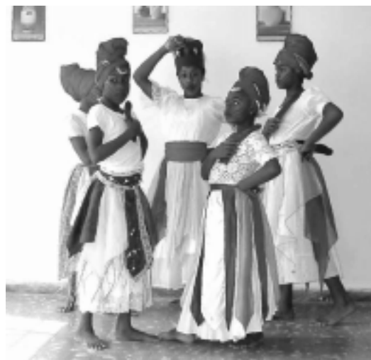
FIG.5: GRUPO FOLKLÓRICO DE NIÑOS

mejoramiento ambiental y reciclajes; 5 intentaban procesos urbanos tales como la iluminación del barrio y la construcción de casas; 17 tenían una orientación especialmente social, entre ellas 7 iniciativas proponían programas para atender niños ▶ 82, 1 se dirigía a personas de la tercera edad, otra a madres solteras y otra a niños discapacitados mentales; finalmente había 7 iniciativas para desarrollar actividades recreativas que pudieran interesar al barrio en su conjunto. Prácticamente todas estas iniciativas se han puesto en práctica, algunas iniciadas por comunidades y grupos locales, otras por residentes individuales o instituciones públicas. En la mayoría de los casos estos proyectos se encuentran en operación, aún cuando hay algunos proyectos que han tenido dificultades para su ejecución y mantenimiento, o se han interrumpido. En varios de estos últimos casos no parece ser el origen el factor principal de la situación, sino problemas burocráticos, de financiamiento, o discrepancias personales.