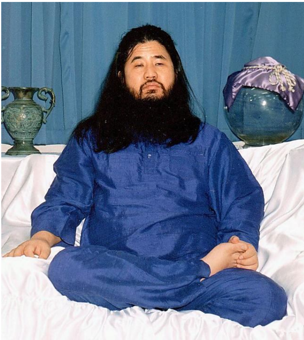
Сёко Асахара. Портрет.