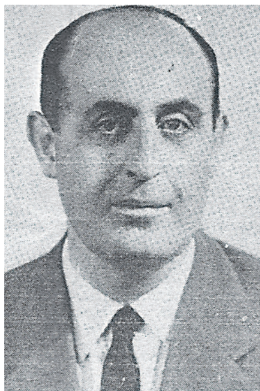
Felip Dulanto Escofet, creador de l'escola de Dermatologia Mèdico-Quirúrgica, a la Universitat de Granada