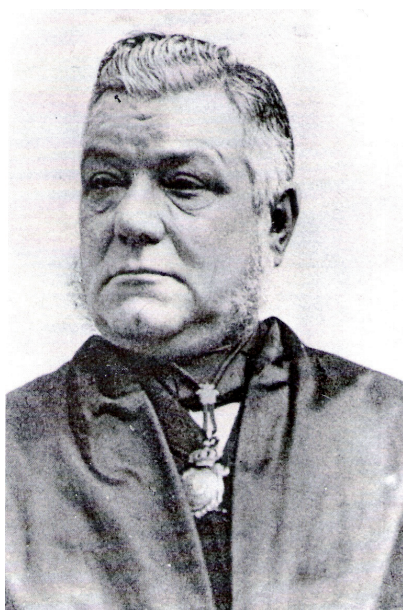
Giné i Partagàs primer Catedràtic de Cirurgia que va fer una obra dermatològica extensa