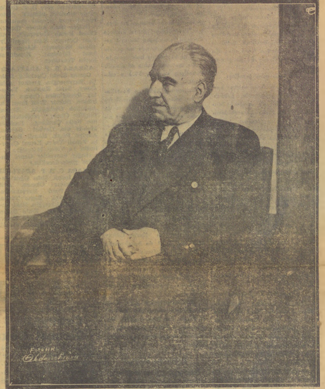
BUGÜN EBEDİYEN KAYBETTİĞİMİZ MERHUM MAREŞAL FEVZİ ÇAKMAK

Fuad Sadık Kralın sevgili kardeşi değilmiş San Fransisko, 10 (A.P.) — Mısır Prensesi Faika, dün, koşullarıyla (Devamı Sa: 2, Sü: 7 de)