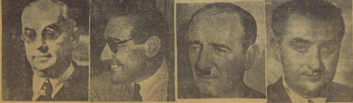
Celâl Bayar Adnan Menderes Fuat Köprülü Faruk Nafiz Çamlıbel