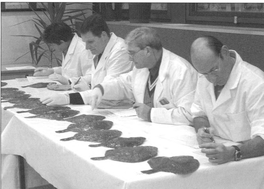
KIM-keuring in actie.

De introductie van de verkoop op afstand via internet (e-commerce) heeft de interesse voor objectieve versheidbepaling nog aangezwengeld. De internetkoper heeft immers nood aan een éénduidige indicatie van de kwaliteit van het product en van zijn versheid in het bijzonder. Visveilingen die geïnteresseerd zijn in een uitbreiding van hun cliënteel via e-commerce, hebben dus baat bij een ondubbelzinnige indicatie van de versheid van hun producten. Deze gedachtegang heeft de drie Vlaamse visveilingen ertoe gebracht om gezamenlijk een project op te zetten rond versheid-