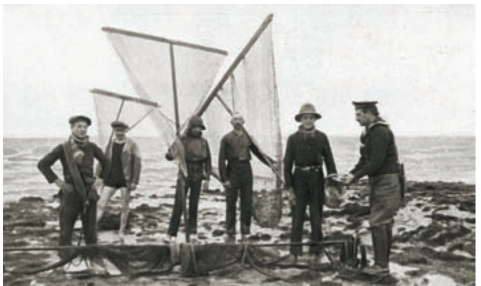
■ Vlaamse strandvissers poseren voor een (verplichte) foto. Een soldaat van de Marineabteilung bekijkt de vangst. De houterig poserende vissers met respectievelijk een sleepnet en drie steeknetten voldoen aan de wensen van de fotograaf, maar uit niets blijkt dat ze maar één voet in het water hebben gezet

Dat het Marinekorps zichzelf graag voorstelde als de beschermer van het bedreigde Kust-Vlaanderen konden we zien in het " Kriegs-Album des Marinekorps Flandern 1914-1917 ". Maar ook officieren waren niet schuw om zich te gedragen als geëerde en geliefde gasten. De burgerbevolking – en vooral kinderen – werden er al eens bijgehaald om de foto extra luister te geven.