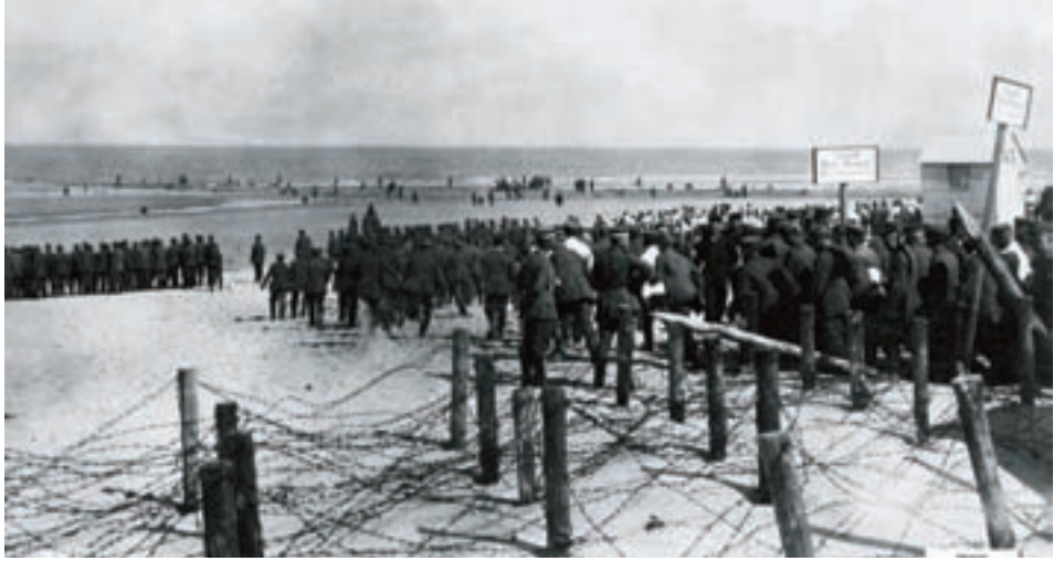
■ Bij een dergelijke foto van het strand in Oostende met honderden 'losgelaten' soldaten schrijft men: “Beginn der Bade-Saison in Ostende” . De Duitse soldaten hadden als het ware de tijd om het nieuwe badseizoen in te leiden en hier rustig wat pootje te baden!

Officieren en gezagdragers poneerden zich daarbij liefst als belangrijke en graag geziene kuurgasten. Ze eisten niet alleen het meest exclusieve deel van de Oostendse badzone op, ze wilden zich ook enkel omkleden in luxe cabines. En zoals het past bij mannen van aanzien laten ze zich in tenue fotograferen als souvenir voor thuis. Voor de manschappen stelde de Marine een reddingsboot met (onervaren) Duitse redders