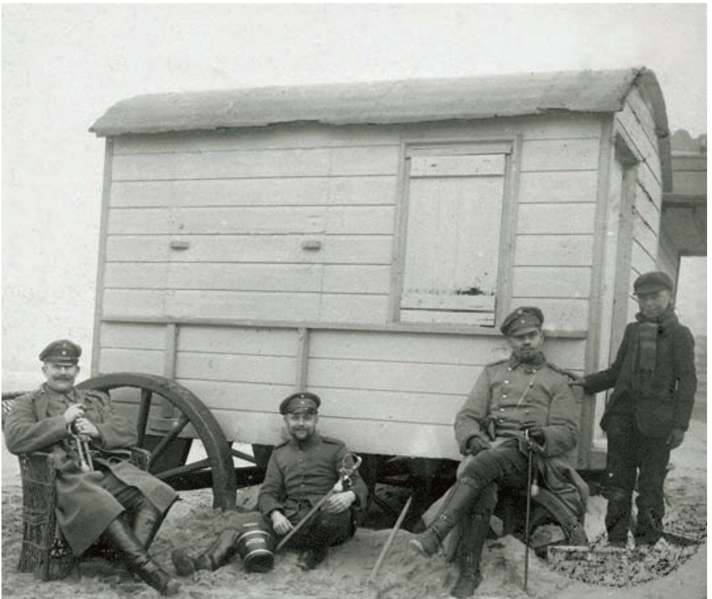
■ Drie officieren, gefotografeerd in hun badzone proberen niet-houterig over te komen. Nonchalant gezeten in een rieten zetel, met een emmertje (met "Oostende" op) tussen de benen en vergezeld van een Oostends jongetje, willen ze de indruk geven geëerde en welgekomen gasten te zijn

ter beschikking. Voor de overige delen van het strand – deze van de officieren en onderofficieren – moest Oostende opdraaien. De Oostendse (ervaren) redders hadden nu een nieuw cliënteel: Duitse officieren in zwembroek... Het verschil tussen onervaren en ervaren redders resulteerde op 6 september 1915 in de verdrinkingsdood van 11 soldaten. Hoe vaak de reddingsboot gebruikt is om drenkelingen uit het water te redden weten we niet, maar steevast was hij één van de geliefde decorstukken (met het Koninklijke Chalet op de achtergrond) als geslaagd strandkiekje (zie foto).