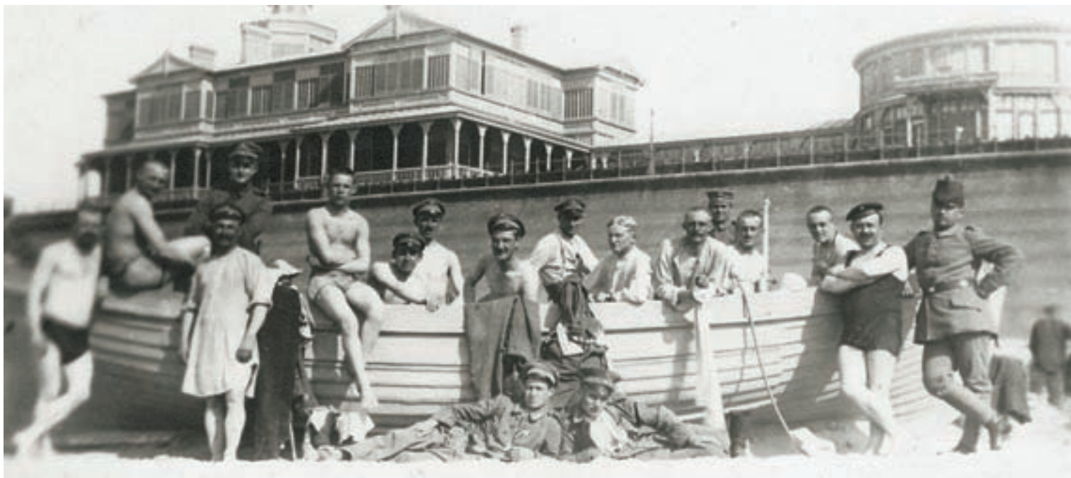
■ Een niet-gebruikte reddingsloep als decorstuk met op de achtergrond het Koninklijke Chalet. De Duitse soldaten staan in zwemtenue met hun soldatenpet op, als onderdeel van hun badkostuum (Collectie Erwin Mahieu)