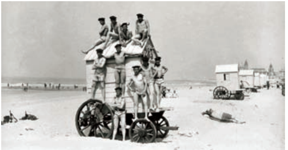
■ Een postkaart die door de troepen vaak naar de 'Heimat' werd gestuurd is deze van een groep soldaten die op een badkar is geklauterd op het strand van Oostende. Het kostuum is nu een zwembroek, maar met het militaire hoofddeksel op. Met dergelijke postkaarten werd het thuisfront gerust gesteld en gesust zodat de oorlogsinspanningen konden blijven doorgaan