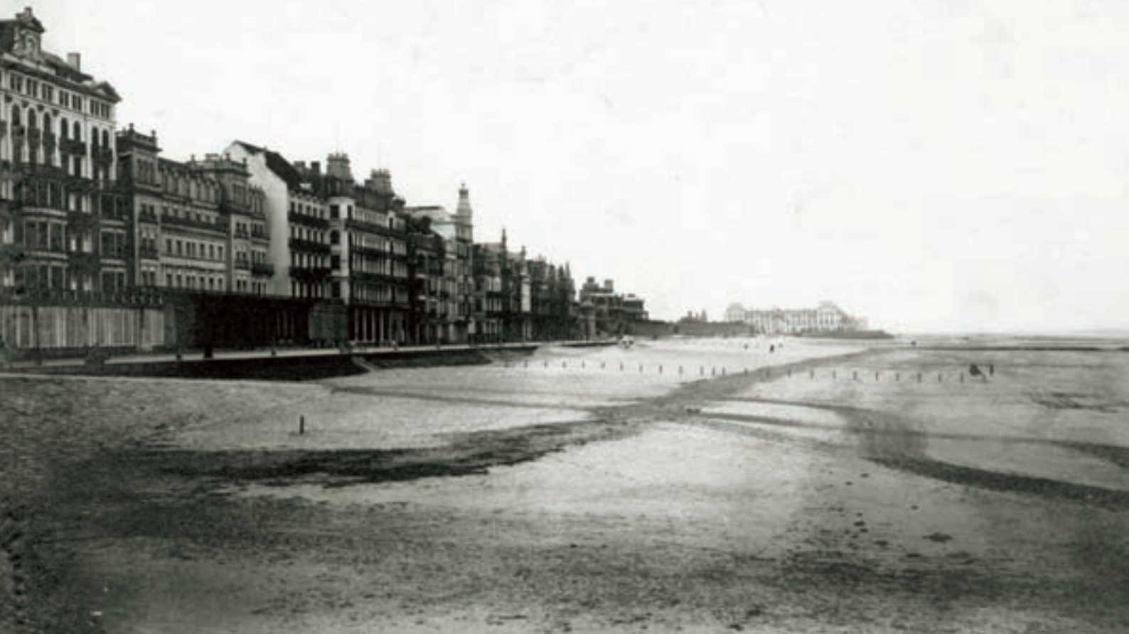
■ Het strand van Oostende, desolaat en zonder badkarren, wordt in het voorjaar van 1915 heringericht met een badendienst voor militairen