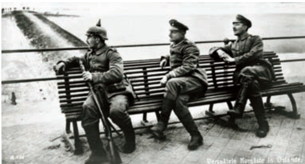
■ Oostende was vóór de Eerste Wereldoorlog dé ontmoetingsplaats van de gegoede burgerij. Duitse soldaten, niet vertrouwd met het mondaine leven in Oostende van weleer, dachten zich nu als kuurgasten te mogen beschouwen. We zien drie militairen op een bank op de zeedijk. Ze worden voorgesteld als Verspätete Kurgaste in Ostende

Het strand werd nu ingedeeld in met prikkeldraad afgebakende zones. De zone voor de officieren begon aan de helling aan het Kursaal en liep tot aan de Wenenstraat (heden Kemmelbergstraat). Burgers mochten