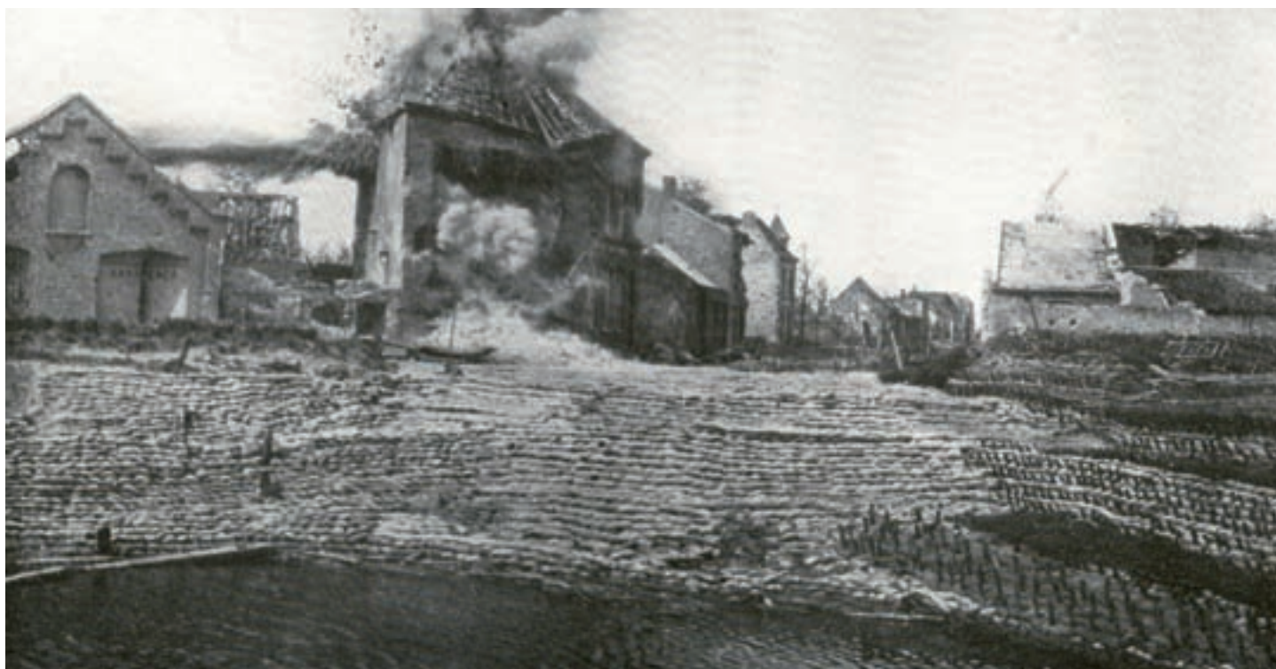
■ Een nooddam op het kanaal Nieuwpoort-Duinkerke op het moment van een bominslag (Kristof Jacobs, Nieuwpoort Sector 1917)

De controle over de diverse inundaties was niet evident. Het sluizencomplex lag onder Duits vuur en de vrees bestond dat de Duitsers de inundatie van de rechteroever misschien wel via de afwateringsluizen van Oostende zouden proberen te neutraliseren. De controle over de gevoerde onderwaterzettingen was vooral het werk