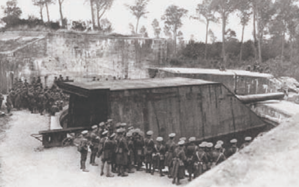
■ Het langeafstandskanon de Lange Max in Moere kon Duinkerke bereiken