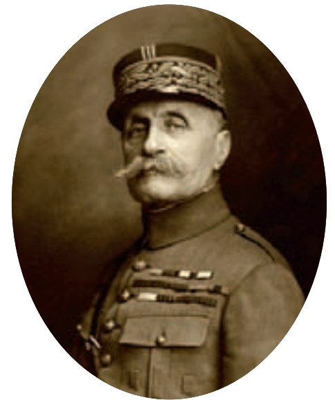
■ Generaal Ferdinand Foch (1851-1929) gaf pas op 24 oktober zijn akkoord voor een inundatie op Belgische bodem