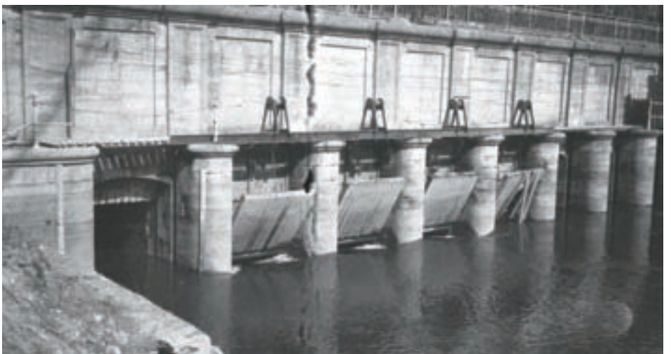
■ De schuiven van de Noordvaart, die bij de tweede poging geopend werden (Kristof Jacobs, Nieuwpoort Sector 1917)

monde van kapitein-commandant Prudent Nuyten, beroep op Karel Cogge (1855-1922). Cogge was toezichter bij de Noordwatering, kende de waterhuishouding van het gebied als geen ander en kon in deze zijn specifieke vragen van Nuyten beantwoorden. Nuyten was ook in staat – in tegenstelling met vele andere van de legerstaf – met Cogge te converseren, gezien zijn kennis van het West-Vlaamse dialect. Uit deze bevraging kwam uiteindelijk een concreet plan naar voor. Dat plan ging uit van wat op dit eigenste ogenblik de nieuwe Belgische verdedigingslinie vormde: de spoorwegberm tussen Nieuwpoort en Diksmuide. De tijd drong: de Franse legerleiding had zijn eigen inundatieplan al in werking gezet om via de sluisen van Duinkerke het gebied rond het riviertje de Colme en t.h.v. de Franse Moeren onder water te zetten. Concreet hield dit in dat wat restte van de Belgische legermacht slechts via enkele corridors kon terugtrekken en dus in de val zat bij een eventuele Duitse doorbraak. Onder druk van deze omstandigheden viel de beslissing de IJzervlakte zo snel en zo uitgebreid mogelijk onder water te zetten.