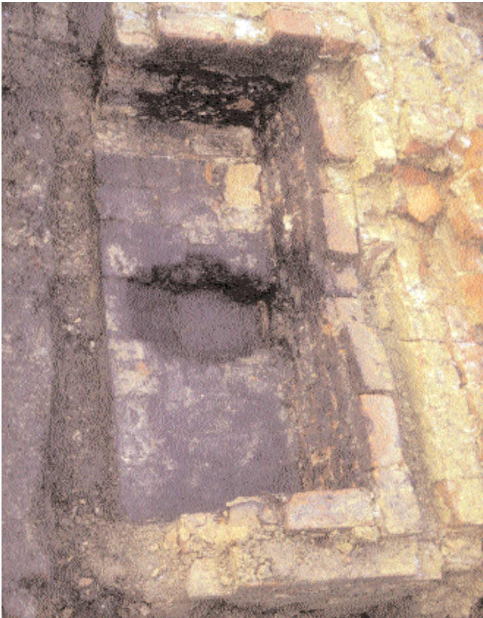
Haard van een mogelijke 17 de -eeuwse haringrokerij te Mechelen (WW)

Sinds 1992 voert het IAP in samenwerking met de provincie West-Vlaanderen archeologisch onderzoek uit naar het verdwenen laatmiddeleeuws visserijdorp Walraversijde. Sinds 24 juni 2000 is op het domein Raversijde een provinciaal archeologisch museum aanwezig gewijd aan deze uitzonderlijke site (MD)