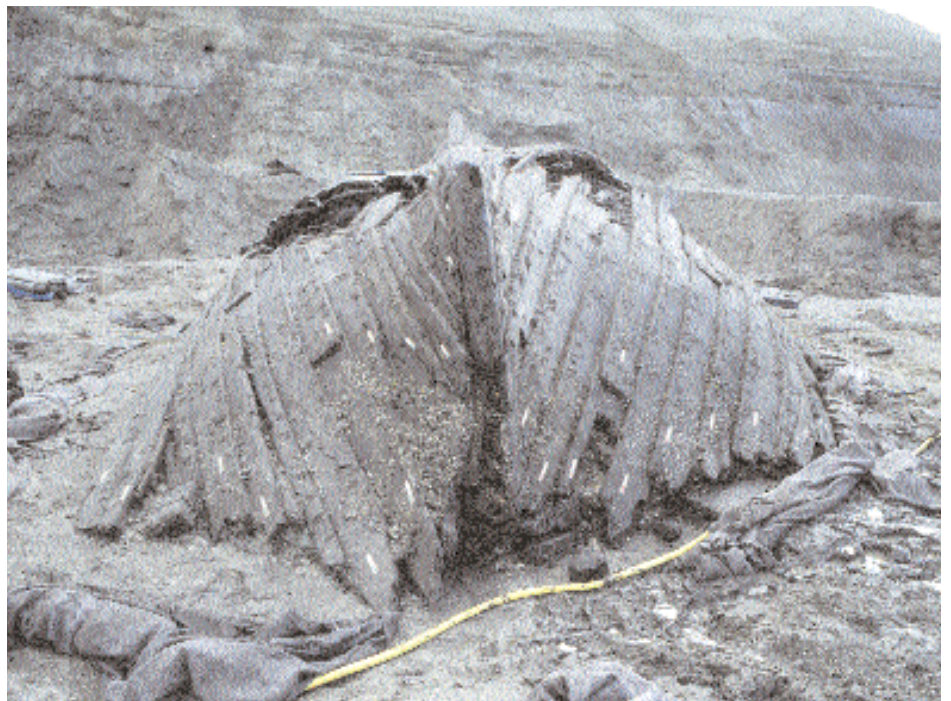
De kogge van Doel, het voormalige 'werkpaard' van de hanzesteden (HD)

De zuidelijke Noordzee herbergt een groot aantal scheepswrakken. Slechts een beperkt aantal hiervan is reeds in detail gedocumenteerd en bestudeerd. In het Belgische deel van de Noordzee alleen al zijn 228 scheepswrakken in kaart gebracht en gedocumenteerd door de afdeling Waterwegen Kust van de administratie Waterwegen en Zeewezen (AWZ-WWK), en dit enkel in functie van de veiligheid