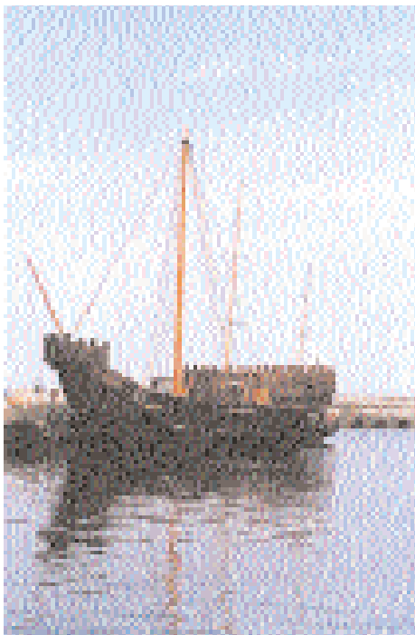
Een replica van een middeleeuwse kogge in de haven van Simrishamn (Zweden) (RA)

(zie kader) - om slechts twee van de meest bekende te noemen - maar daar blijft het dan meestal bij. Maar ook Vlaanderen heeft een zeer rijke maritieme traditie. Het hoeft dan ook weinig betoog dat er ook hier wel degelijk nood is aan een onderzoekseenheid van de overheid die zich buigt over het maritiem en fluviaal archeologisch patrimonium. Niet overtuigd? Oordeel dan zelf maar op basis van enkele hieronder opgesomde voorbeelden.