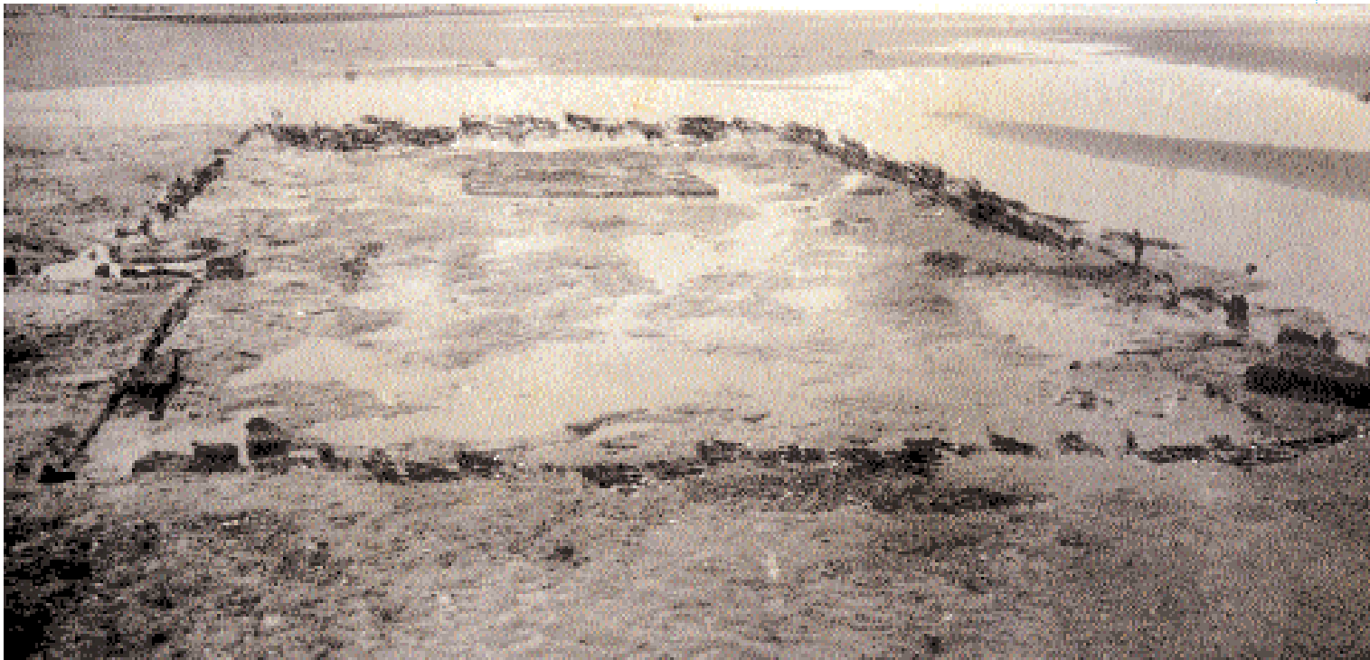
Een bij laagtij blootgespoelde middeleeuwse woning op het strand van Raversijde (AC)

Daarnaast moeten we ook bedenken dat de Noordzee nu gebied in beslag neemt dat acht tot tien-duizend jaar geleden gewoon land was. Het spreekt voor zich dat her en der dus ook resten van prehistorische aanwezigheid kunnen verwacht worden. Resten van Romeinse aanwezigheid op de kustlijn zijn eveneens hoofdzakelijk in zee te verwachten.