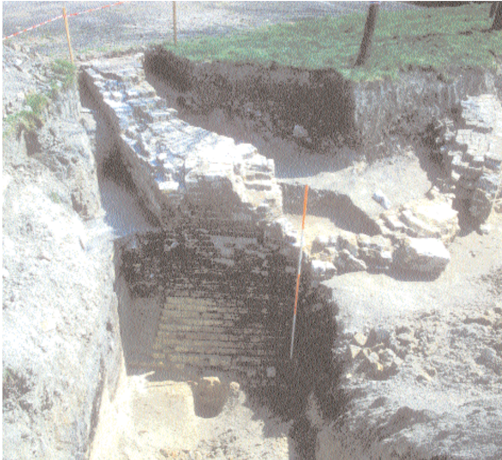
Muurresten van een vuurtoren te Nieuwpoort (MaD)

Daarnaast komen bij allerhande graafwerken nog regelmatig boten of resten van boten aan het licht. Zo is in de winter van 2002-2003 op het strand van Knokke een 19 de -eeuwse houten boot (zie illustratie) vrij-