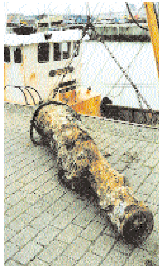
Dit ijzeren kanon werd aan wal gebracht door het Oostends vissersschip Boreas (TT)