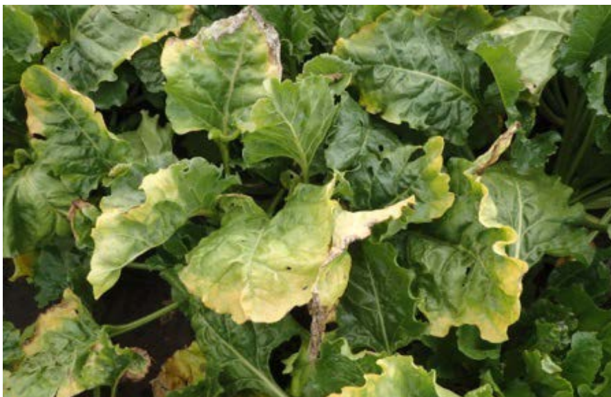
Figuur 4. Detailfoto op 7 september van onbehandeld veldje (Gele necrotische randen).