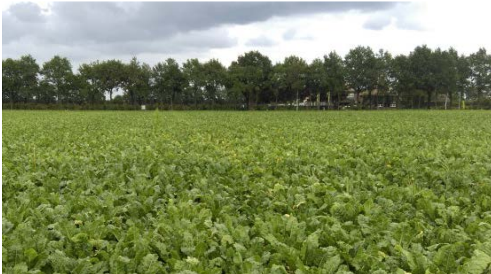
Figuur 6. Kleurverschillen in proefveld op 18 september (Op voorgrond groen vitaal loof achter geel blad).

In tabel 4 zijn de gemiddelde beoordelingen van de gewasstand en kleur van het loof in het groeiseizoen weergegeven.