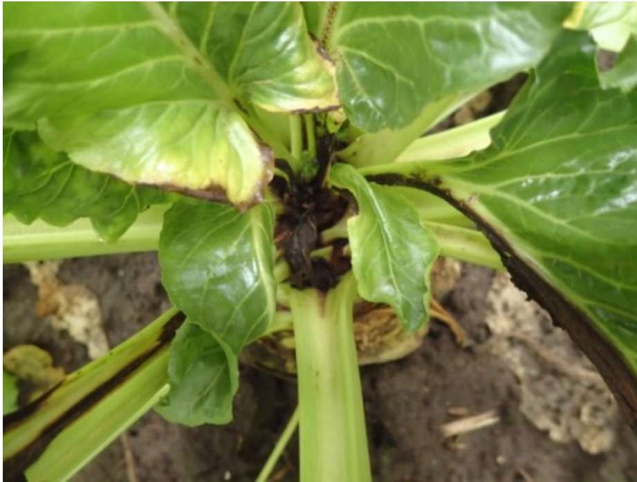
Figuur 5. Foto van aangetast hart van een bietenplant op 7 september.