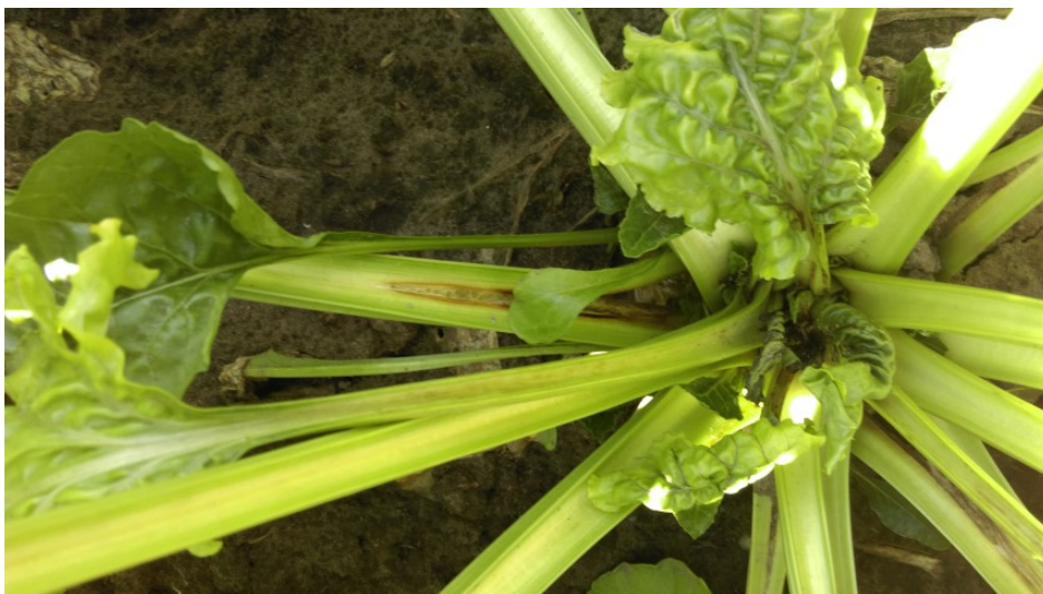
Figuur 1. Foto van hartrot in suikerbieten in het proefveld op 3 augustus.

Begin augustus is in het proefveld voor het eerst hartrotverschijnselen (gevolg van B-gebrek) op het proefveld waargenomen. In veldjes van de objecten A (onbehandeld) en D (Molytrac) werden enkele bieten met verkurkte bladstelen en vergroeide bladeren in het hart waargenomen (Figuur 1).