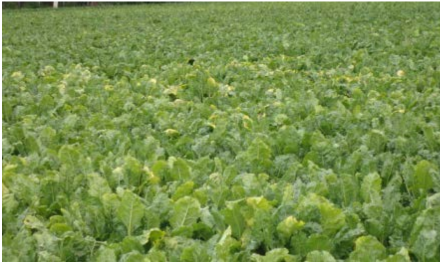
Figuur 3. Veldje met gele loofranden op 7 september (Onbehandeld).