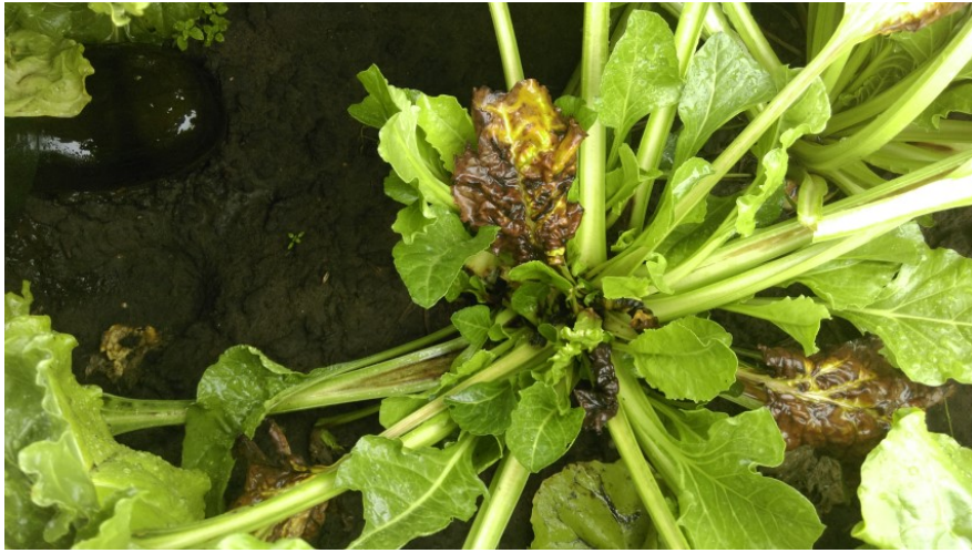
Figuur 2. Foto van hartrot in suikerbieten in het proefveld op 17 augustus.