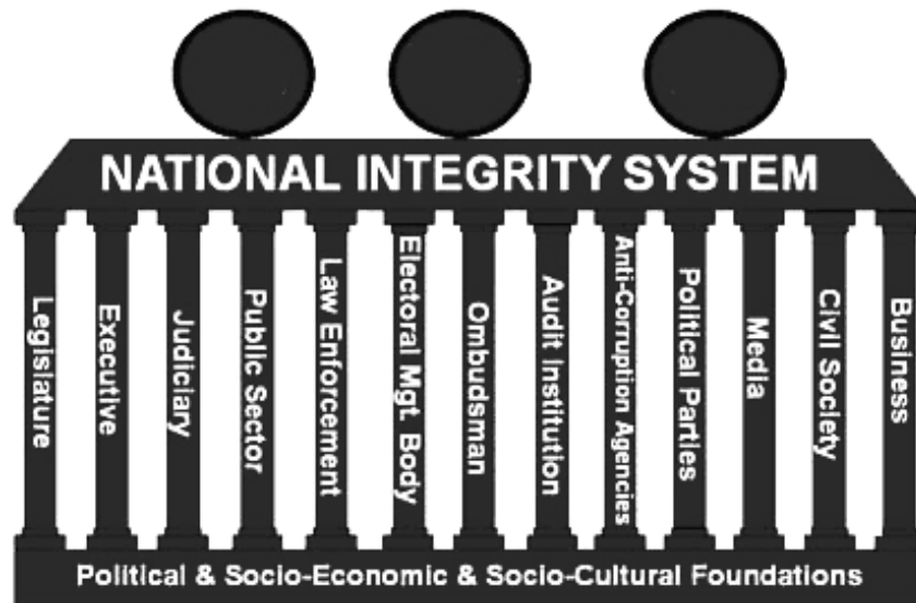
1 Figuur 25.2 De elementen van een National Integrity System