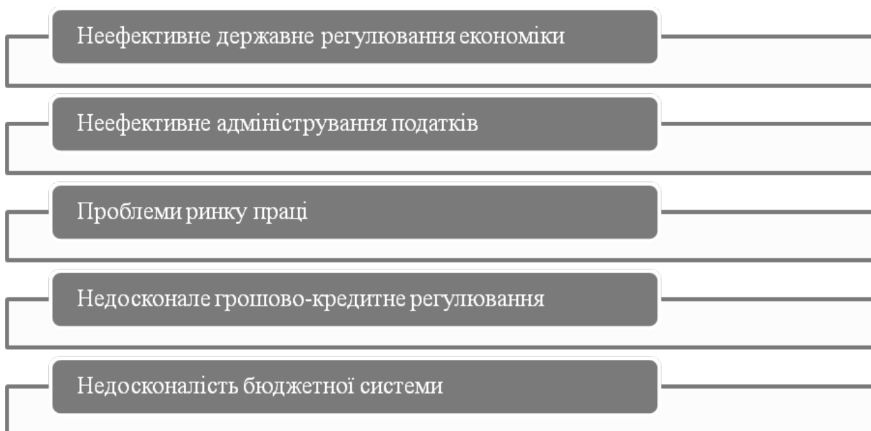
Рис.1. Чинники тіньової економіки

Чинники тіньової економіки представлені на рис.1