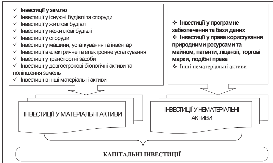
Рис. 1. Класифікація капітальних інвестицій (за методикою Держкомстату України)