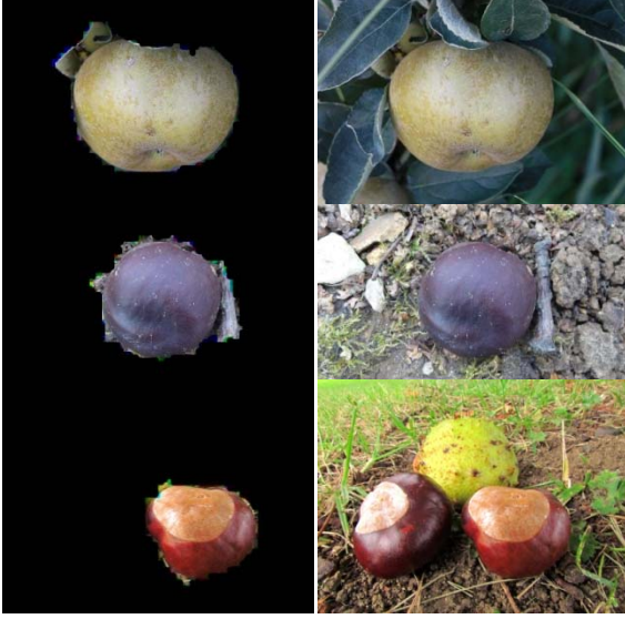
Şekil 1: Solda: Bölüntülenmiş meyveler, Sağda: Orijinal görüntüler