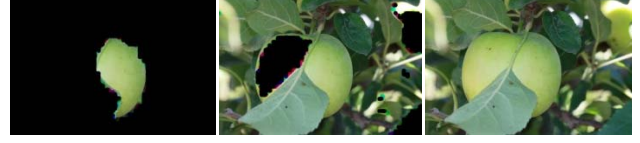
Şekil 4: Solda, meyvenin iki farklı eşikle tespiti, sağda meyvenin kendisi