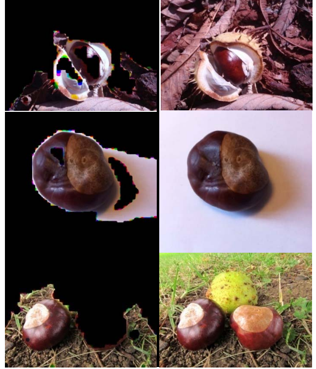
Şekil 3: Solda: tespit edilmiş meyveler, sağda: orijinal resimler

Şekil 2'deki örneklere bakıldığında, meyveleri parlaklığı çok büyük bir problem yaratmazken, arkaplana göre değişik renklerde olan meyveler, sistemimiz tarafından başarıyla saptanmaktadır. Sistemin bir başka başarısı ise, Şekil 3'te de görülebileceği gibi, farklı renklerde olan grupların dahi, belli bir çembersellik katsayısı dahilinde bir araya gelip meyvenin tamamını oluşturabilmesidir.