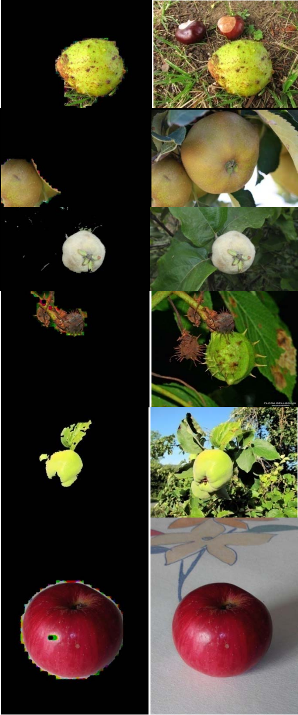
Şekil 2: Solda tespit edilmiş meyveler, sağda orijinal görüntüler