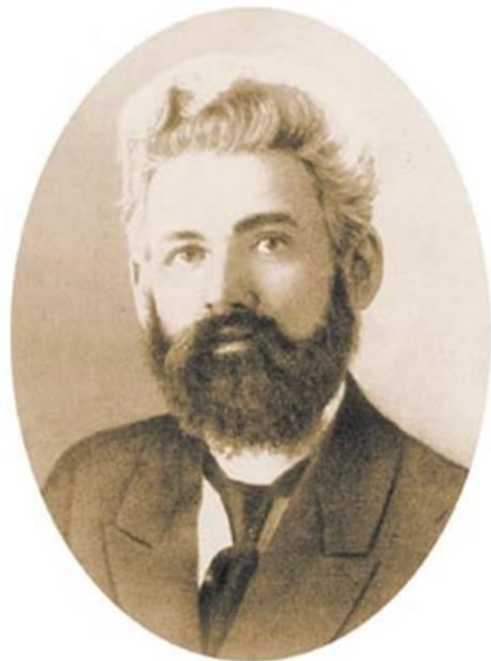
Лев Семенович Берг (1876 —1950)