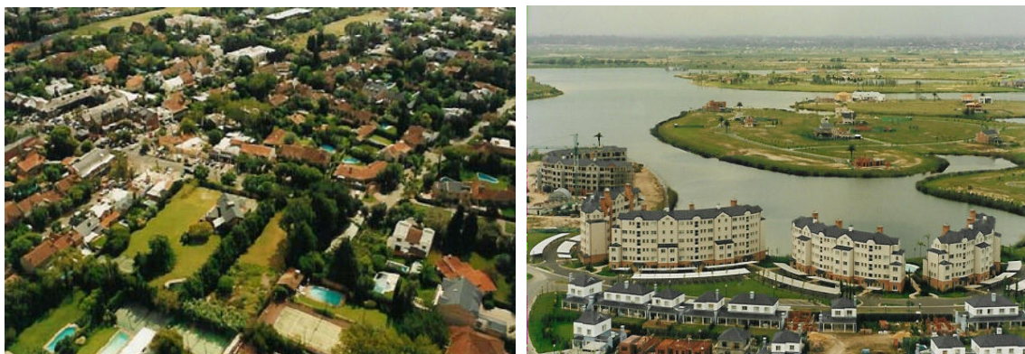
Figura 1: Tejido residencial unifamiliar tradicional en la zona Norte del Gran Buenos Aires; y tejido residencial unifamiliar-multifamiliar de nuevas elites de desarrollo reciente (Nordelta, Partido de Tigre, Pcia. de Buenos Aires)