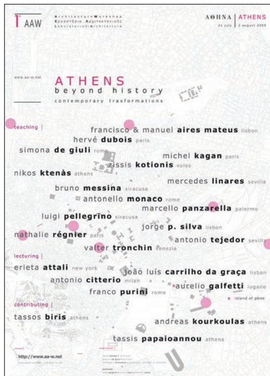
Athens beyond history. International Workshop. Athens, July-August 2009. Manifesto/Poster

Mies van der Rohe – quello che è possibile, quello che è necessario e quello che ha senso” (Mies, 1965. Principi di insegnamento di architettura. In Neumeyer, 1995, 507).