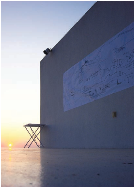
Athens beyond history. International Workshop. Athens, July-August 2009. La parete della casa di Galfetti con gli schizzi al tramonto/ The painted wall of the Galfetti's house at sunset

convinto che nell'organizzazione didattica della Progettazione continuerà a prevalere il modello del laboratorio che lo studente sceglie a partire dalla conoscenza acquisita di impostazione del lavoro e di un modo di fare reiterato del docente. Perché in un laboratorio lo studente, attraverso il proprio lavoro, aumenta le sue conoscenze, scopre il modo per risolvere i problemi, trae conclusioni, esercita le sue abilità, trova un suo particolare metodo di progettare e, infine, identifica l'esperienza con la libertà creativa. Il laboratorio di architettura dovrebbe configurare, pertanto, un territorio concettuale e materiale in cui si moltiplichino le possibilità di manifestare, rendere visibili e presenti quelle condizioni che rendono sensato, possibile e necessario il lavoro dell'architetto.