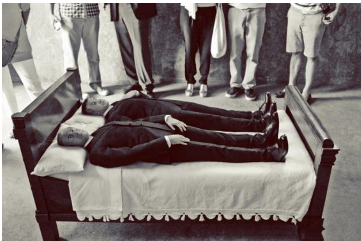
Fig. 9: Maurizio Cattelan, We , 2010.

We consiste in due statue iperrealiste che rappresentano Cattelan, le sculture sono poste sul letto di morte, le dimensioni dei corpi sono rimpicciolite e indossano un vestito scuro, funebre, un manichino ha una mano appoggiata sul cuore quasi a ricordare il primo autoritratto fotografico Lessico Familiare . In tutta la produzione dell'artista il concetto di morte e il sentimento di fallimento sono una costante che è utilizzata a volte in modo dissacratorio ed altre volte semplicemente attraverso una vena malinconica.