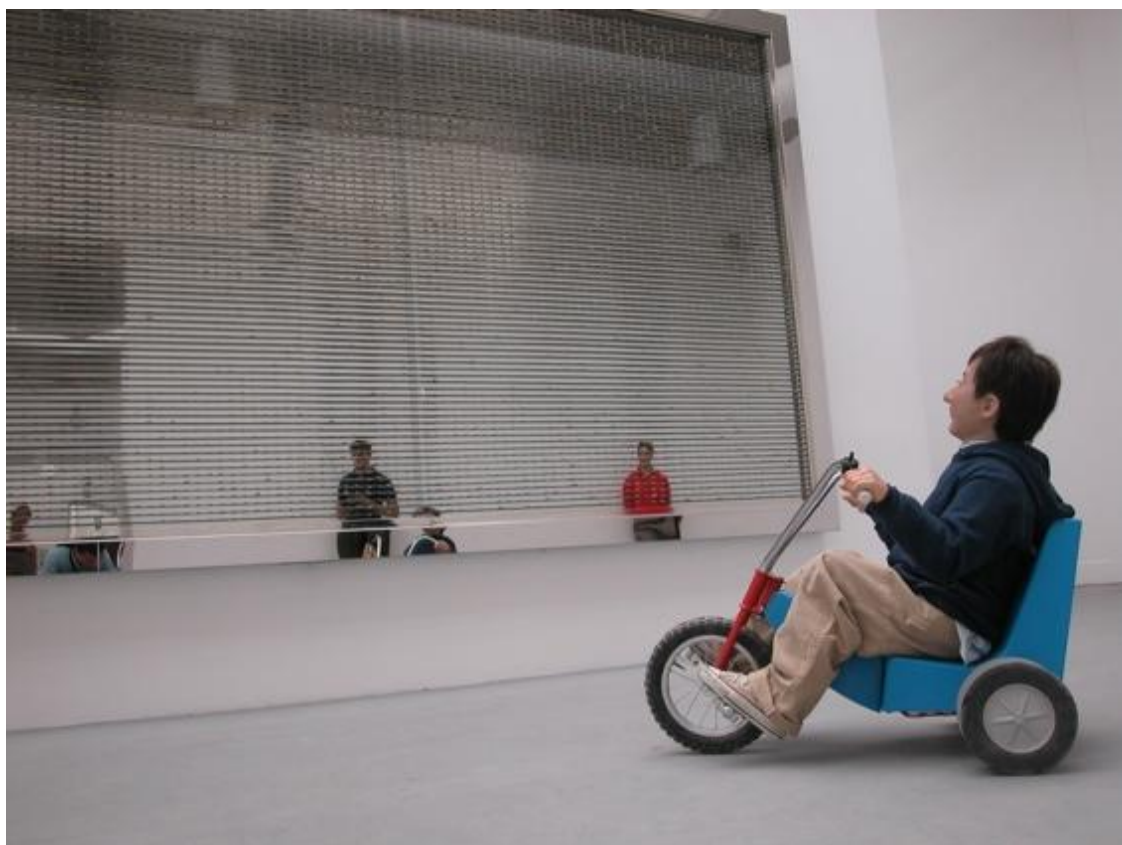
Fig. 7: Maurizio Cattelan. Charlie , 2003.

che come un bambino curioso – in questo caso l'immedesimazione nel fanciullo è nell'atteggiamento - spia dal buco di una serratura. Questa operazione è anche un gesto sarcastico e un'azione ironica rivolta ai grandi capolavori del passato. L'artista vuole inserirsi tra le pagine della storia dell'arte ma allo stesso tempo mette sullo stesso livello se stesso e gli altri artisti diminuendone automaticamente il valore delle opere che hanno fatto la storia.