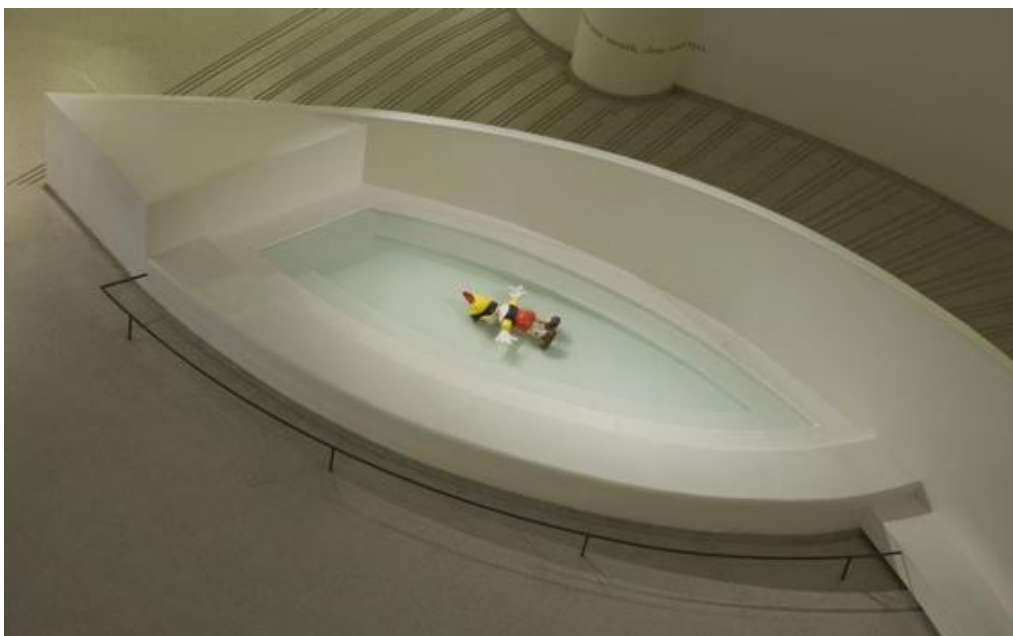
Fig. 8: Maurizio Cattelan, Daddy Daddy , 2008.

Polyurethane resin, steel and epoxy paint. 45,5 cm. x 105 cm. x 94 cm. Installation view: theanyspacewhatever Solomon R. Guggenheim Museum, New York, October 24, 2008-January 7, 2009.