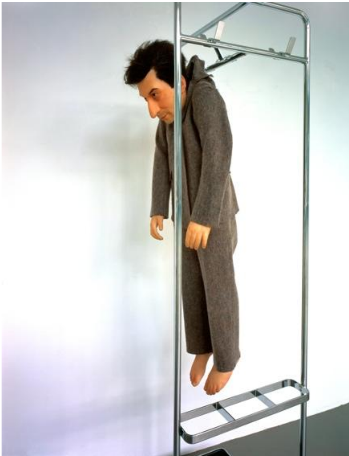
Fig. 6: Maurizio Cattelan. La rivoluzione siamo noi , 2000.

(Starobinski 1984), affermazione questa che si potrebbe ricollegare alla tematica religiosa da sempre centrale nella poetica di Cattelan.