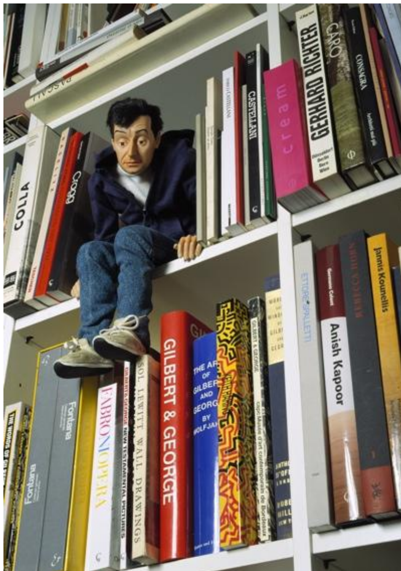
Fig. 5: Maurizio Cattelan. Mini-me , 1999.

Resin, rubber, synthetic hair, paint, and clothing. 45 cm. x 20 cm x 23 cm.