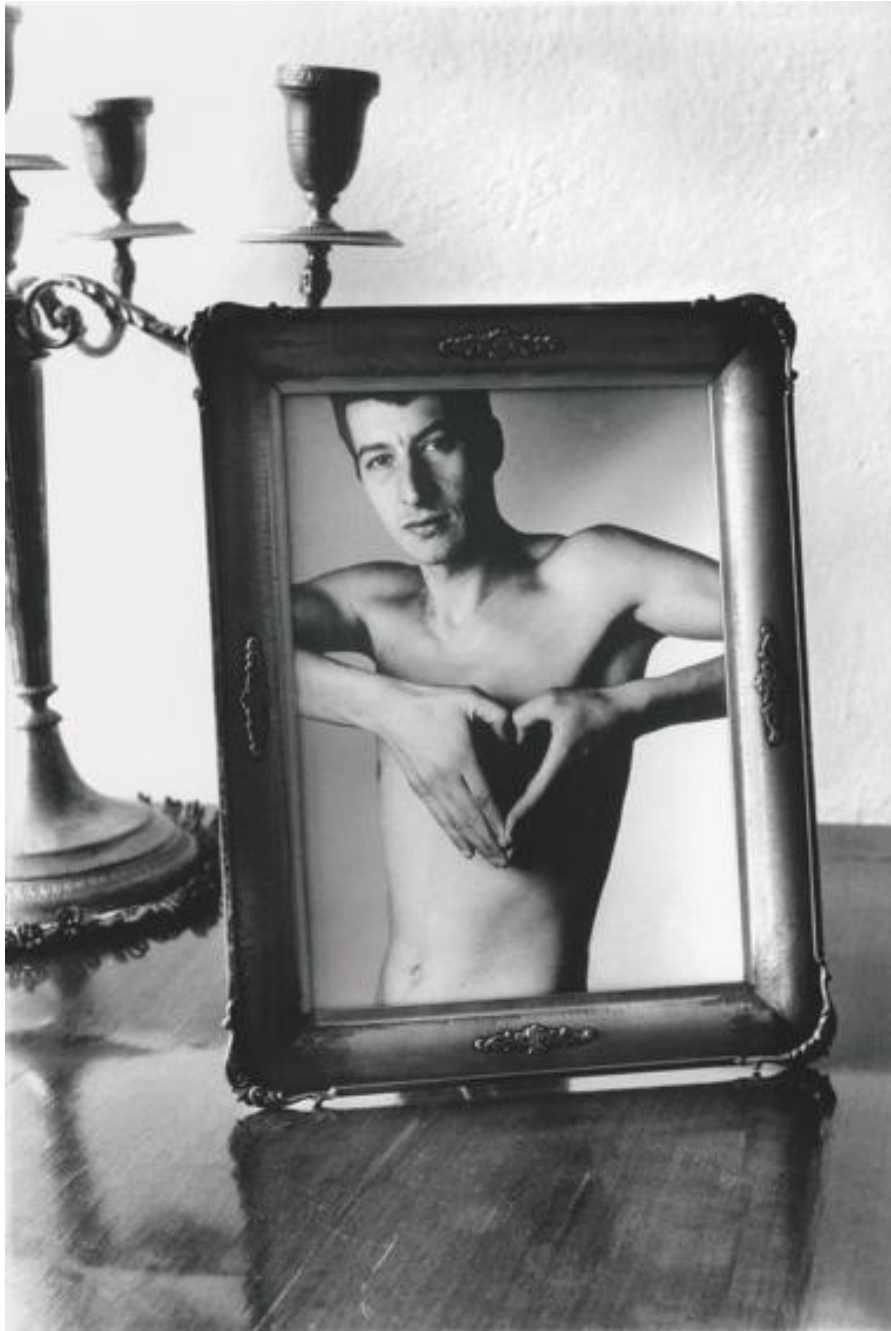
Fig. 1: Maurizio Cattelan. Lessico familiare , 1989.

Black-and-white photograph and silver frame. 19,7 cm. x 15 cm.