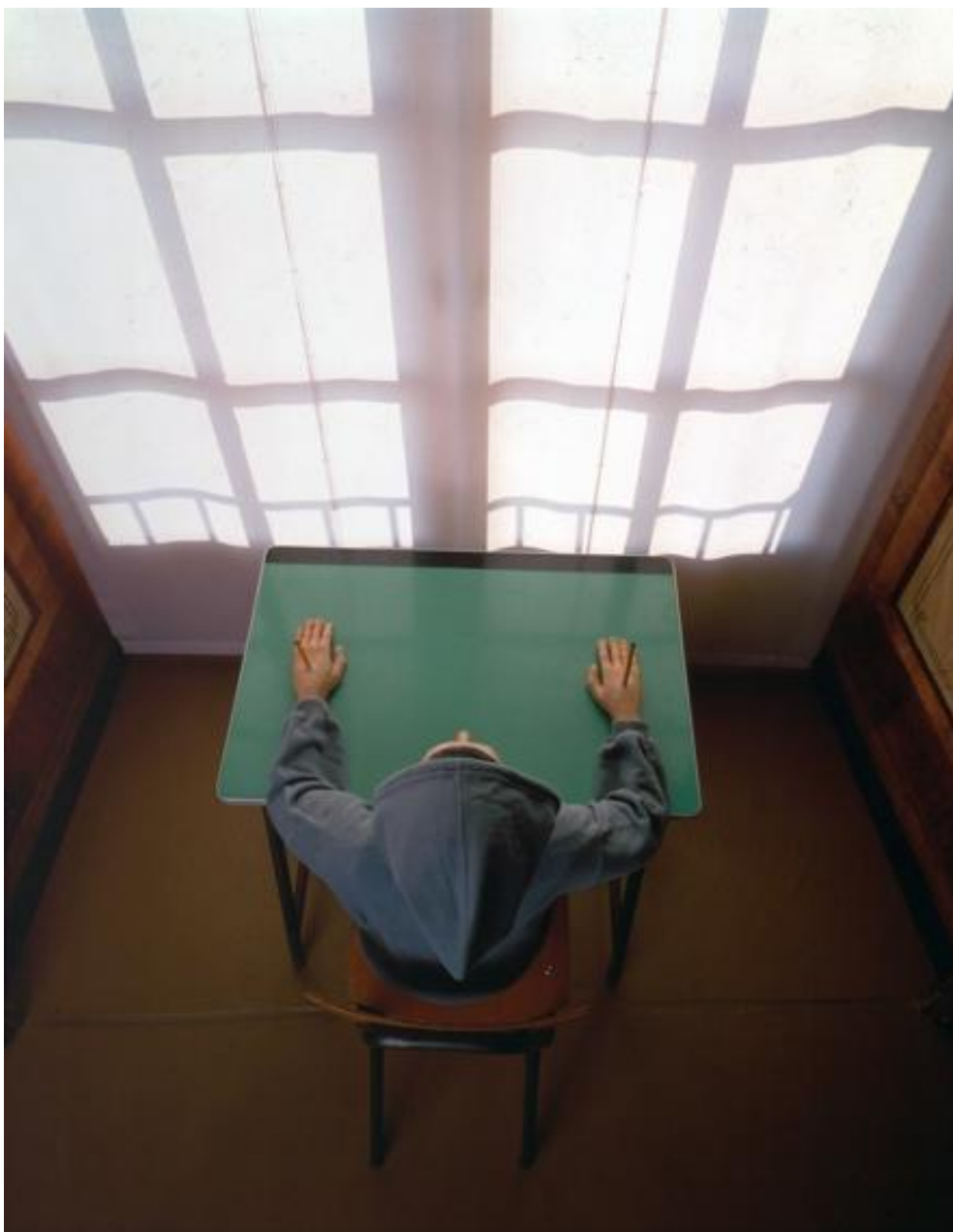
Fig. 4: Maurizio Cattelan, Charlie don't surf , 1997.

Installation view: Maurizio Cattelan. Tre installazioni per il Castello, Castello di Rivoli Museo d'arte contemporanea, Turin, October 21, 1996–June 18, 1997. School desk, chair, mannequin, clothing, shoes, and pencils. 112 cm. x 71 cm. x 70 cm.