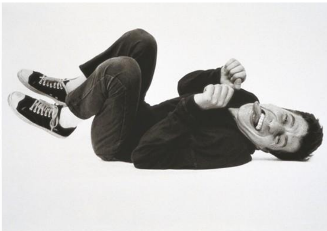
Fig. 2: Maurizio Cattelan, Untitled , 1995

Photographic print 125 cm x 190 cm.