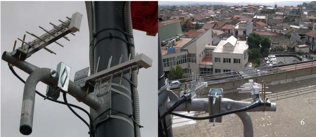
Fig. 6. Le due antenne di trasmissione istallate sul palo fissato sul tetto della scuola media che puntano la sede dell'I.N.G.V. di Nicolosi.

Visti i buoni risultati ottenuti a Stromboli, a Nicolosi è stata istallata anche una telecamera termica Flir 320 M non remotabile posta in apposita custodia stagna dotata di vetro al germanio. La telecamera termica Flir 320 M (Figura 7) monta un ottica da 24° e permette la visione dell'attività vulcanica sia di giorno sia di notte, con uguale risoluzione, anche in condizioni ambientali avverse (presenza di nebbia); inoltre è in grado di fornire i dati relativi alla temperatura massima dell'attività osservata in funzione di alcuni parametri ambientali (Figura 8).