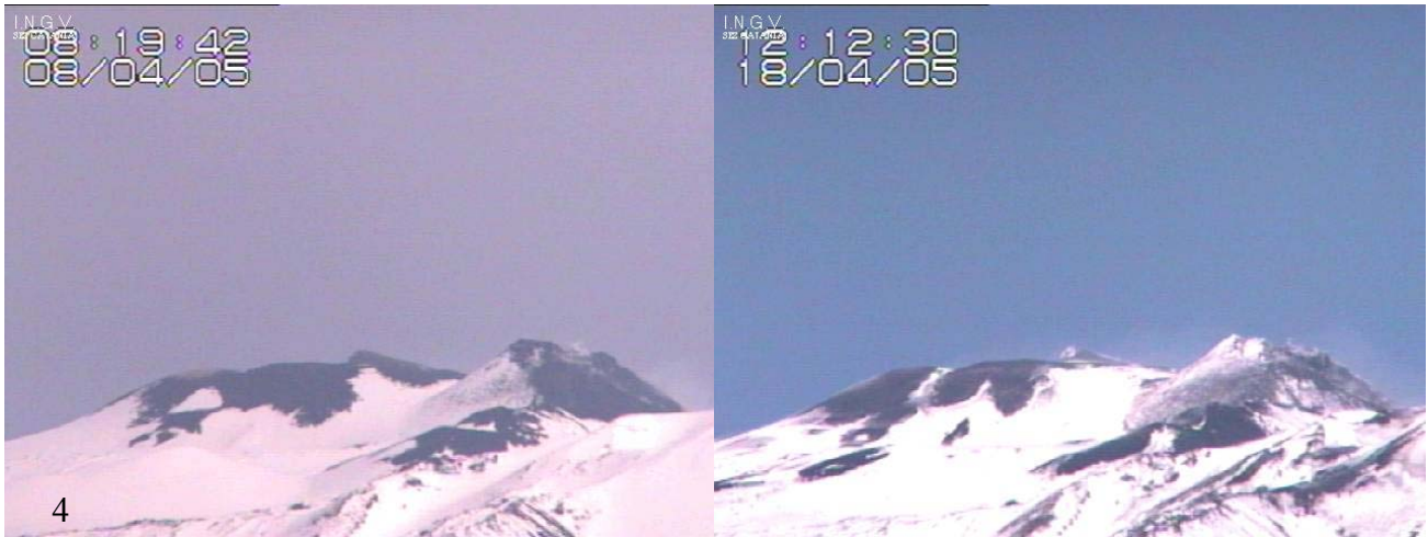
Fig. 4. Immagini dell'Etna riprese dalla telecamera Canon installata a Nicolosi.

Da una qualunque sede dell'I.N.G.V. di Catania, tramite rete informatica ed una coppia di radiomodem (Figura 5), sarà possibile remotare il pan-tilt, lo zoom e l'ottica della telecamera Canon VC-C4R utilizzando un opportuno software dedicato che consente anche di scegliere tra diverse inquadrature già memorizzate.