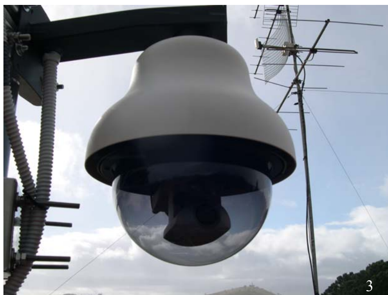
Fig. 3. La telecamera Canon VC-C4R dentro l'apposita custodia stagna.

Queste scelte sono state effettuate per utilizzare materiale standard di buona qualità e facilmente reperibile.