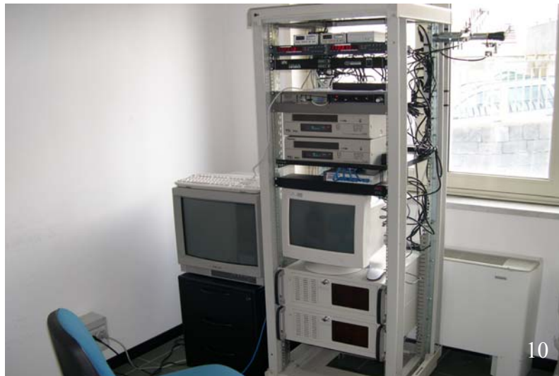
Fig.10. Il rack installato nella sede I.N.G.V. di Nicolosi contenente la stazione video ricevente, i sistemi per l'inserimento della data e dell'orario, i sistemi di acquisizione, di digitalizzazione, di archiviazione, di visualizzazione e di trasferimento dati in tempo reale alla sede di Catania.

Entrambi i segnali video vengono ricevuti nella sede dell'INGV di Nicolosi mediante due antenne logaritmiche periodiche a 10 elementi 1000-2200 Mhz G9-10 DB opportunamente polarizzate e installate su un armadio rack (Figura 10) in visibilità ottica con la stazione trasmittente.