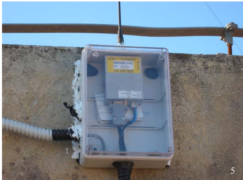
Fig. 5. Uno dei due radiomodem utilizzato per il controllo della telecamera Canon alloggiato dentro l'apposita custodia stagna posizionata sul tetto della scuola media.

Da una qualunque sede dell'I.N.G.V. di Catania, tramite rete informatica ed una coppia di radiomodem (Figura 5), sarà possibile remotare il pan-tilt, lo zoom e l'ottica della telecamera Canon VC-C4R utilizzando un opportuno software dedicato che consente anche di scegliere tra diverse inquadrature già memorizzate.