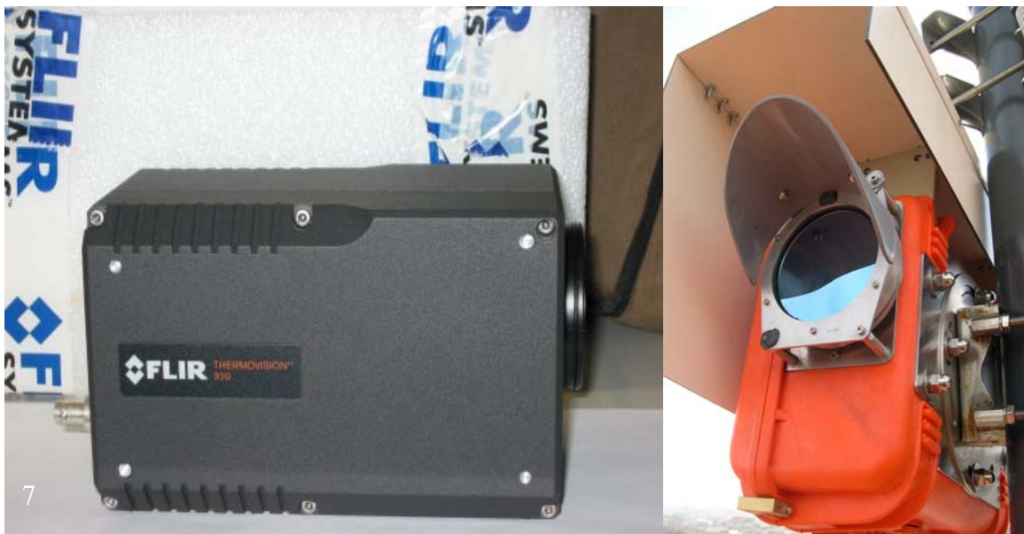
Fig.7. La telecamera termica Flir 320 M e l'apposita custodia stagna istallata a Nicolosi.

Visti i buoni risultati ottenuti a Stromboli, a Nicolosi è stata istallata anche una telecamera termica Flir 320 M non remotabile posta in apposita custodia stagna dotata di vetro al germanio. La telecamera termica Flir 320 M (Figura 7) monta un ottica da 24° e permette la visione dell'attività vulcanica sia di giorno sia di notte, con uguale risoluzione, anche in condizioni ambientali avverse (presenza di nebbia); inoltre è in grado di fornire i dati relativi alla temperatura massima dell'attività osservata in funzione di alcuni parametri ambientali (Figura 8).