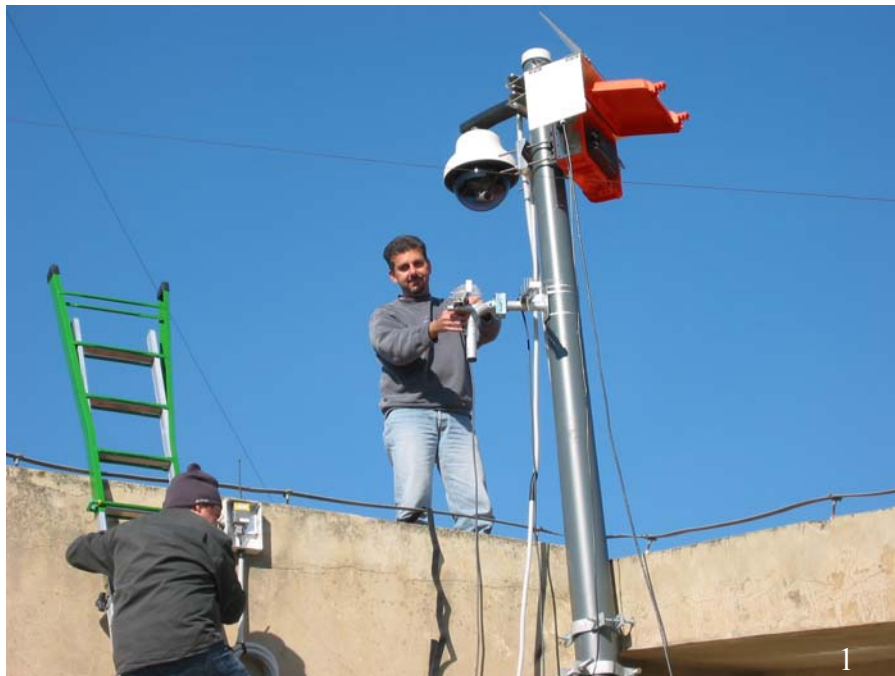
Fig. 1. Il palo e le due custodie stagne delle telecamere installate sul tetto della scuola media di Nicolosi.

Durante la prima fase dei lavori sono stati installati sul tetto della scuola suddetta un palo in fibra di vetro (tipo telecom) alto quattro metri circa (Figura 1), una custodia stagna della Gewiss in poliestere a porta cieca delle dimensioni 800x585x300 modello GW46006 che è stata sollevata da terra di 10 cm mediante appositi supporti ed un quadro elettrico dotato di magnetotermico autoriparante.