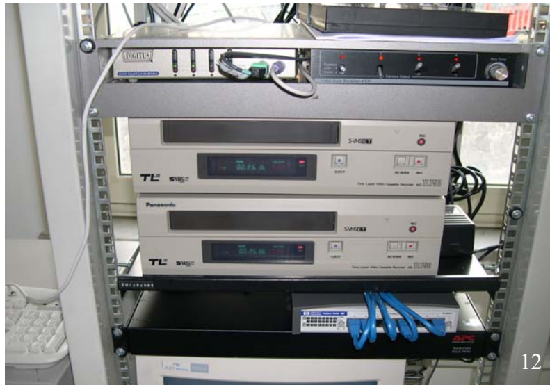
Fig. 12. Il sistema di videoregistrazione analogico mediante apparati time-lapse.

Le videocassette verranno consegnate ai vulcanologi solo su loro esplicita richiesta o in caso di malfunzionamento del supporto informatico.