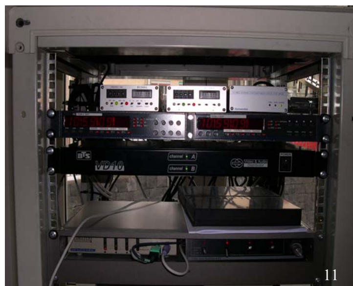
Fig. 11. Sistema di demodulazione a 2 Ghz.

I segnali video transitano attraverso degli amplificatori di segnale a 2,2-3 Ghz per aumentare la qualità del segnale e giungono a due demodulatori programmabili (Figura 11), ciascuno settato in funzione della rispettiva frequenza di trasmissione.