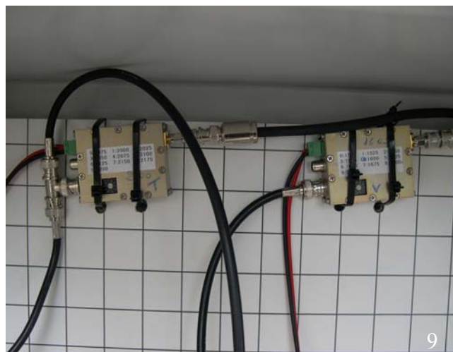
Fig.9. I due trasmettitore video MTX 2100 da 100 mW settati a 2100 Mhz e 1600 Mhz.

Il cavo di alimentazione e l'uscita video della telecamera termica Flir 320 M entrano nella custodia stagna della Gewiss dove è alloggiato anche il trasmettitore video MTX 2100 da 100 mW settato a 2100 Mhz (Figura 9) e la breakout box della Flir che permette una connessione seriale PC \leftrightarrow Telecamera.