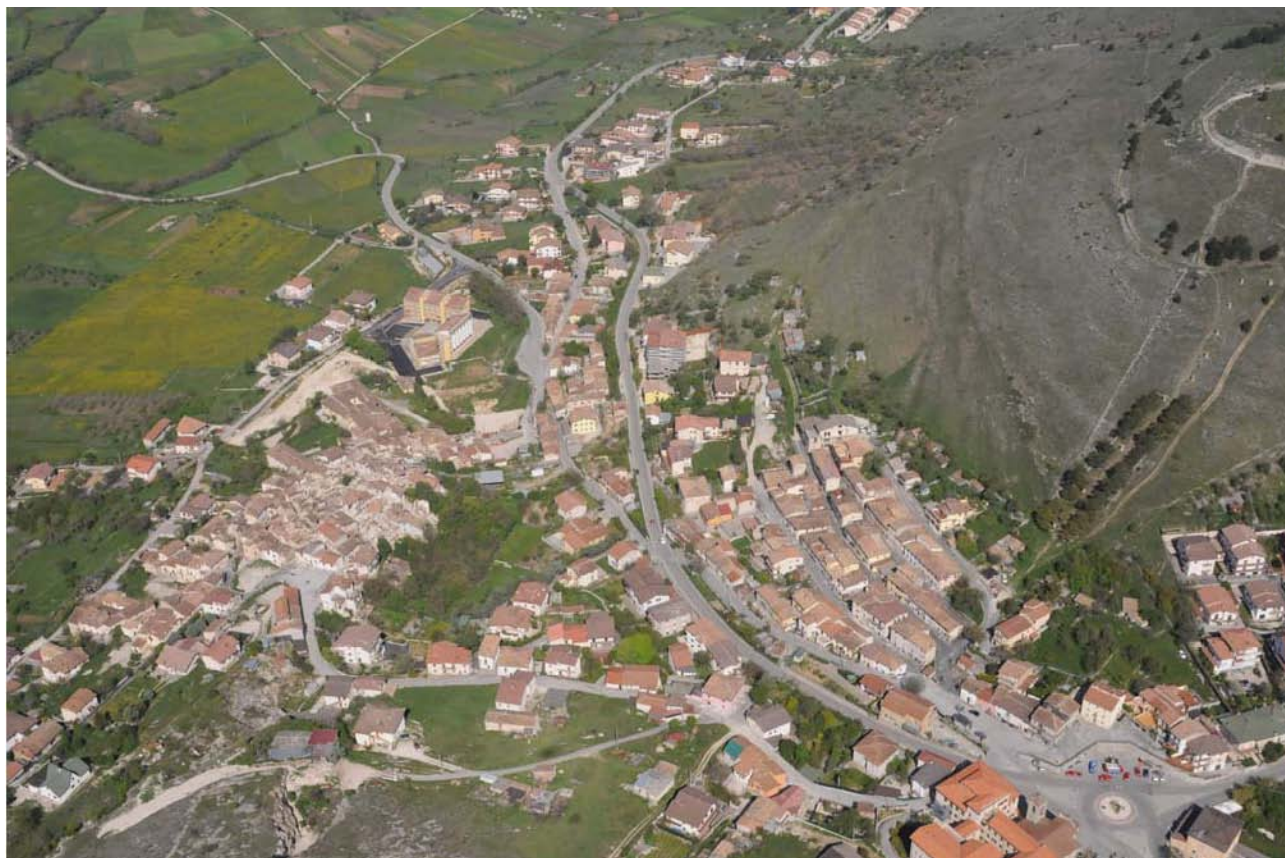
Foto 1 Poggio di Roio. Visibile la netta differenziazione tra il nucleo storico dell'abitato (sulla sinistra) e la parte più recente (sulla destra).

Complessivamente la distribuzione sul territorio di queste tipologie edilizie è risultata molto variabile: in qualche caso gli edifici più recenti rappresentano la semplice espansione centrifuga del vecchio centro abitato, in qualche altro caso ne sono una diramazione, in perfetta continuità, in una data direzione, oppure sono dislocati in un'area contigua, ma chiaramente separata dal centro storico, da una strada o da un elemento morfologico del terreno (Foto 1).