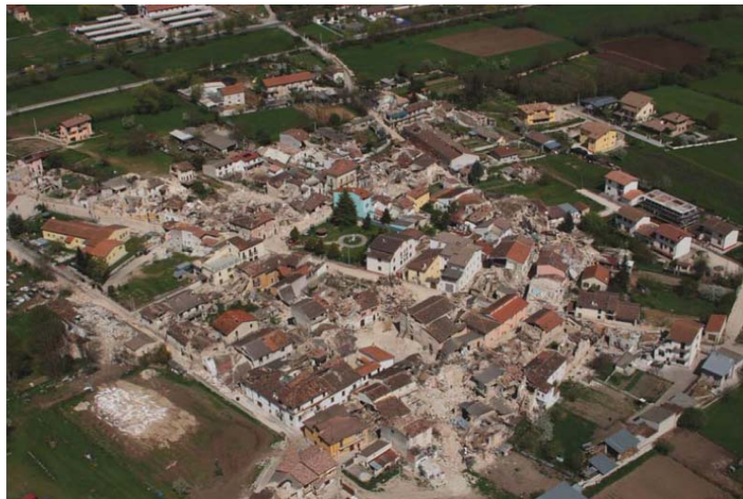
Foto 4 Onna. Foto dall'elicottero.