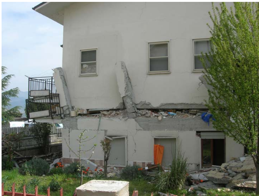
Foto 2 Pianola. Distruzione completa del primo piano.

La rilevante diversità del danneggiamento tra centri storici e settori recenti degli abitati pone comunque un serio problema per quanto concerne la comparazione del grado MCS con il grado assegnato per i terremoti storici, che è valutato su un patrimonio edilizio paragonabile a quello tuttora esistente nei centri storici. Questa tematica richiederà indubbiamente ulteriori riflessioni e sperimentazioni a quanti operano in questo settore di ricerca.