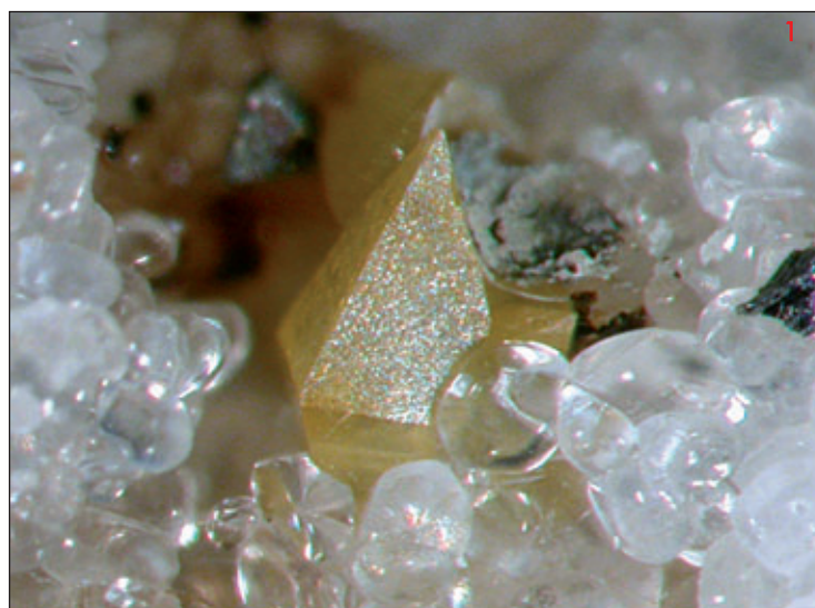
Fig. 1: wulfenite, cristallo bipiramidale giallo di 0.6 mm con "gocce" di calcite - Cava San Vito, Ercolano, Napoli, Campania, Italia

IMMA PUNZO via Epomeo, 72 I-80126 Napoli e-mail: ipunzo@libero.it