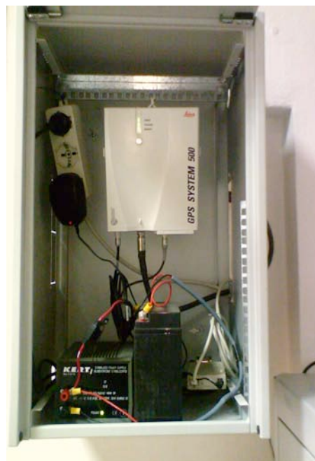
Figura 2. Foto della stazione BLGN, si notano il ricevitore Leica System500 e in basso: a destra il dispositivo MOXA-DX-311, a sinistra l'alimentatore e la batteria tampone.

Il comando inf serve per la diagnostica del sensore, quello cfg per la sua configurazione mentre quello dwn per lo scarico dati e l'eventuale cancellazione della memoria, in Figura 3 viene mostrata un'applicazione del comando di diagnostica in ambiente Microsoft Windows XP®.