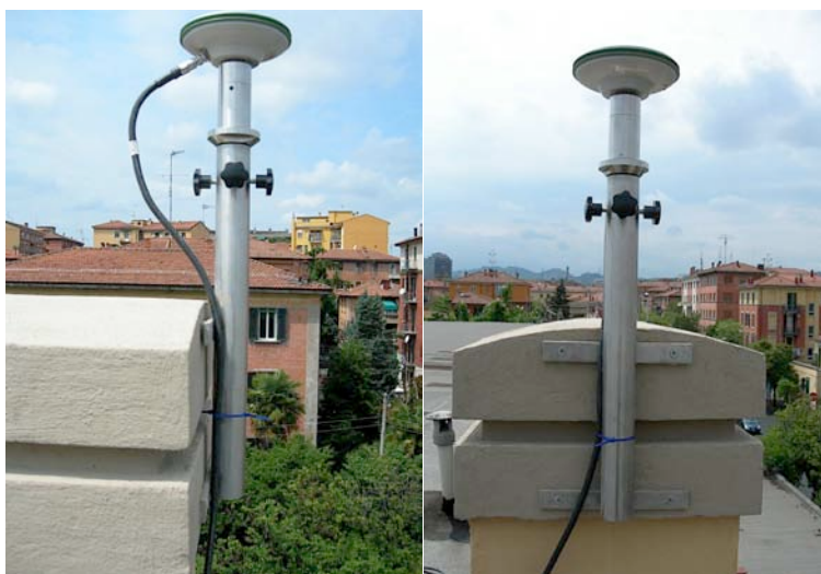
Figura 1. Foto della tecnica adottata per la monumentazione della stazione BLGN.

La scelta di tale modello di supporto, realizzato appositamente su commissione non essendo prodotto da alcuna ditta, ha permesso di ovviare a problemi di "tenuta" puramente meccanici (effetto vento e pioggia), nonché a quelli determinati da una corretta ed accurata calibrazione "in bolla" dello strumento stesso. L'installazione è avvenuta in due fasi successive: 1) montaggio verticale del palo con una prima taratura grossolana della verticalità; 2) taratura di precisione, grazie allo snodo sferico predetto, della base dell'antenna GPS sul piano orizzontale (messa in bolla definitiva).