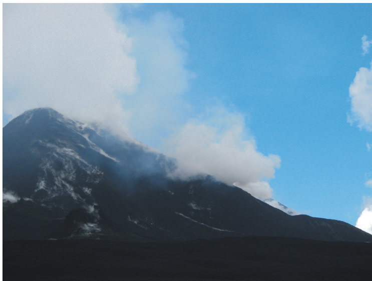
Fig. 3 – Immagine del degassamento alla bocca sul fianco orientale del cratere di Sud-Est osservato da Torre del Filosofo.

Per quanto riguarda gli altri crateri sommitali, sono state osservate emissioni gassose di discreta portata soprattutto al cratere di Nord-Est, il cui degassamento ha mostrato un carattere pulsante. Da sottolineare invece la ripresa dell'emissione gassosa dalla bocca sul