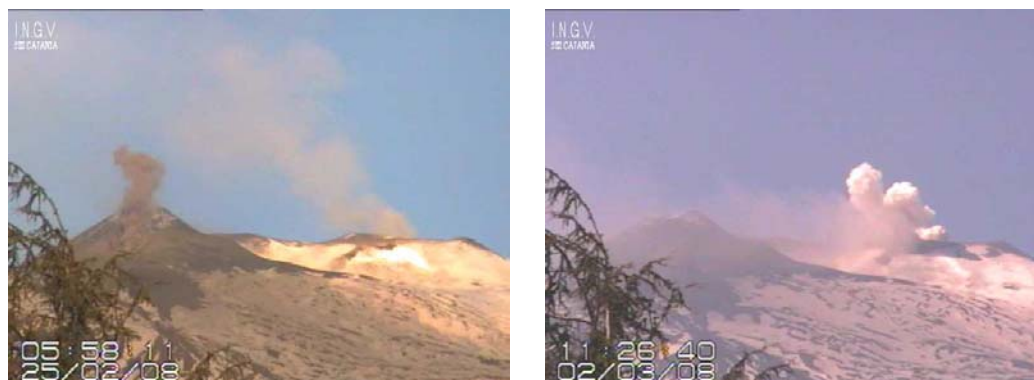
Fig. 2 - Immagini riprese dalle telecamere INGV, Sezione di Catania posizionate a Milo che mostrano, rispettivamente, uno degli eventi esplosivi alla bocca sul fianco orientale del cratere di Sud-Est avvenuti il giorno 25 febbraio e un impulso di gas al cratere di Nord-Est registrato il 2 marzo.

i tempi sono GMT): dalle 5:18 alle 6:14 (sei eventi); dalle 10:22 alle 11:18 (sette eventi); dalle 13:31 alle 13:44 (due eventi di minore intensità); dalle 16:26 alle 17:17 (sei eventi); dalle 21:14 alle 22:55 (otto eventi).