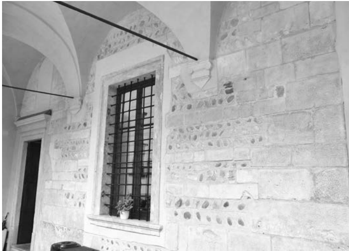
Tav. 5 - Verona, S. Giorgio in Braida, chiostro, porzione muraria dell'ala orientale (terzo-quarto decennio del sec. XII).