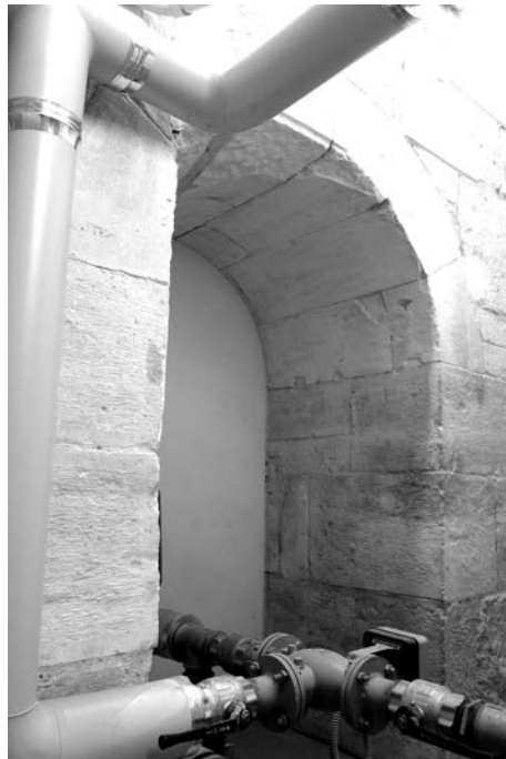
Tav. 4 - Verona, S. Giorgio in Braida, vano interno della torre campanaria romanica, porta meridionale a pieno sesto (terzo-quarto decennio del sec. XII).