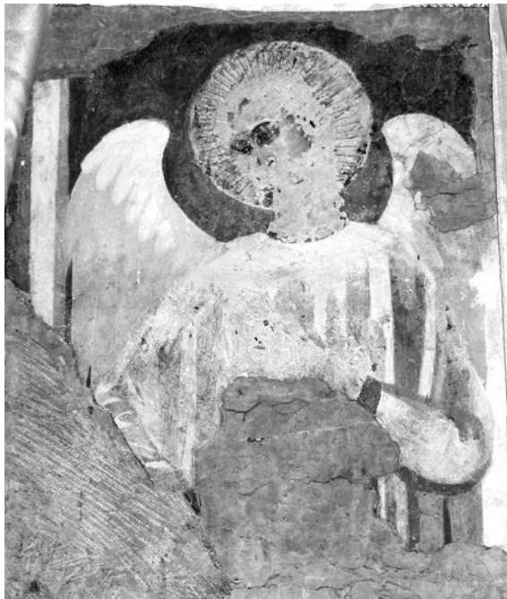
Tav. 6 - Primo maestro di S. Zeno (?), Angelo (terzo decennio del sec. XIV). Verona, S. Giorgio in Braida, interno, terza cappella settentrionale.