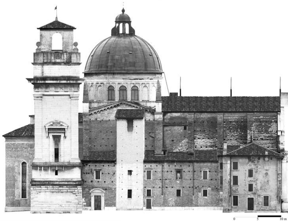
Tav. 1 - Verona, S. Giorgio in Braida, ortofotopiano del prospetto settentrionale (restituzione a cura di "Geogrà s.r.l."; per gentile concessione della parrocchia di S. Giorgio in Braida).