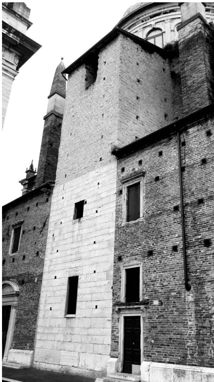
Tav. 2 - Verona, S. Giorgio in Braida, fianco settentrionale, porzione superstita della torre campanaria romanica (terzo-quarto decennio del sec. XII).