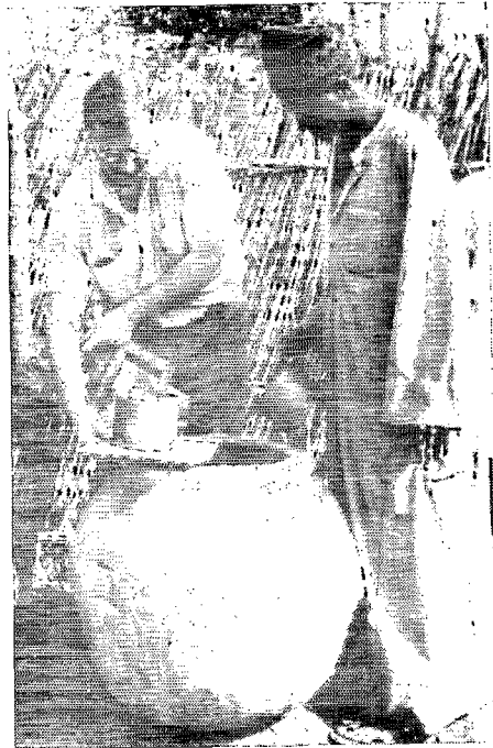
2. Id. Khombole. (Sénégal).