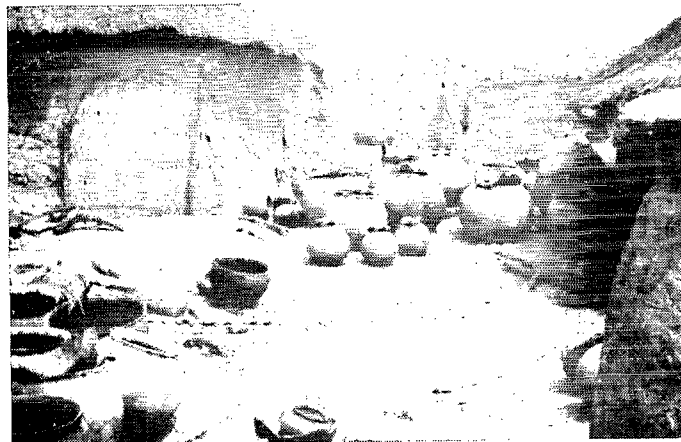
5. Jarres de stockage et ustensiles domestiques. Ethnie Lobi. (Haute-Volta).

PRINCIPAUX TYPE DE GITES DOMESTIQUES D' Aedes Aegypti EN AFRIQUE DE L'OUEST