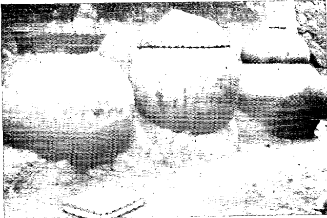
1. Jarres de stockage d'eau de boisson. Ethnie Ana. (Togo).