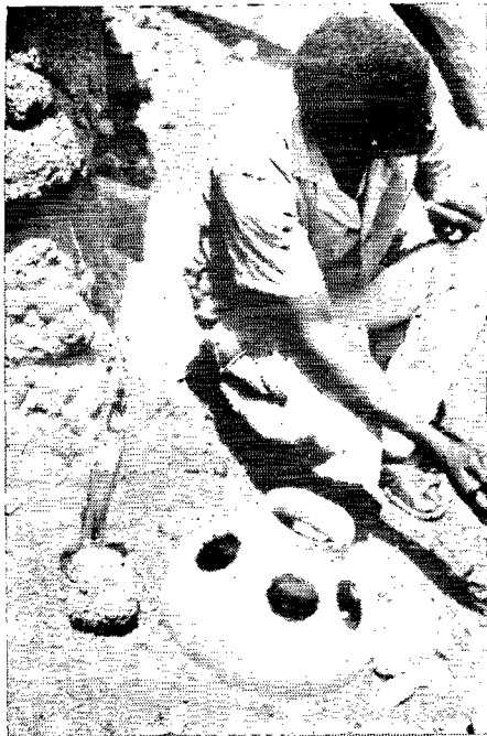
4. Abreuvoir à poulet. Ethnie Lobi. (Côte d'Ivoire).