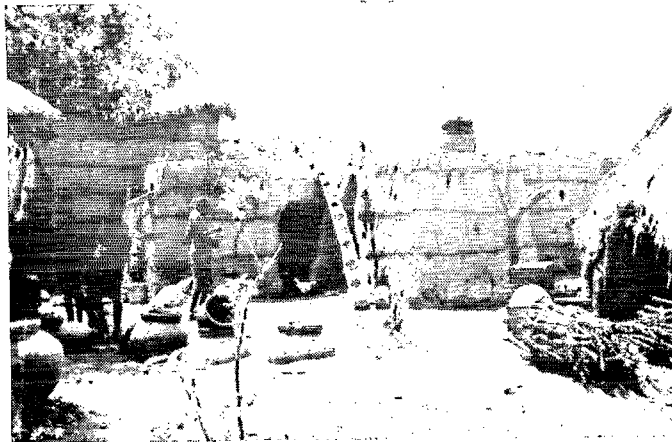
3. Jarres de stockage et ustensiles domestiques. Ethnie Mossi. (Haute-Volta).