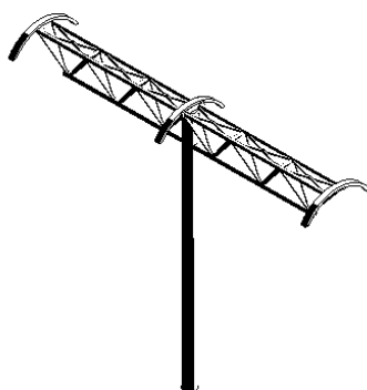
Рисунок 1. Геометрическая модель каркаса навеса остановки.

При выполнении моделирования использовалась академическая лицензионная версия программного комплекса ANSYS WORKBENCH, любезно предоставленная разработчиками, на основе которой выполняется оптимизация конструкции. В результате исследований выполнено построение геометрической модели (рисунок 1). К конструкции были приложены значения снеговых нагрузок на верхнюю поверхность, также были учтены возможные значения сейсмического воздействия, при которых рассчитаны прочность и устойчивость конструкции в период эксплуатации.