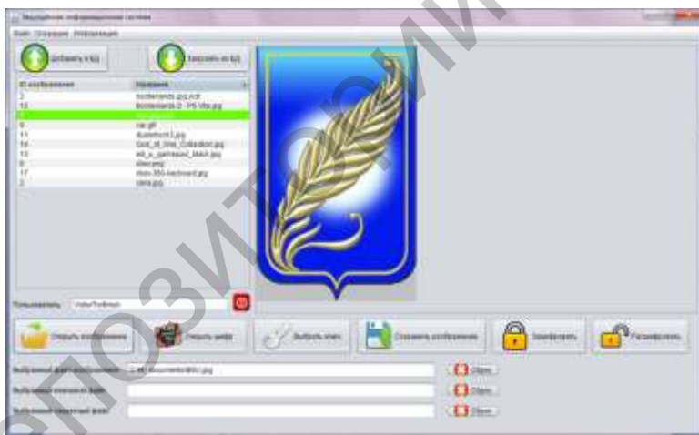
Рис. 3. Основное рабочее окно разработанного приложения

В будущем данный труд будет развит за счёт дополнительных исследований реализованной модели генератора хаоса и доработки программного комплекса с целью повышения его криптостойкости.