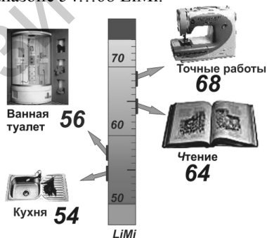
Рисунок 2 - Вариант шкалы LiMi на упаковке осветительных приборов

Для оценки возможностей выбора источников света для массового потребителя в бытовых условиях, была выбрана ранее предложенная логарифмическая единица измерения освещенности LiMi. В качестве нормативного документа был использован ТКП 45-2.04-153-2009. Естественное и искусственное освещение. Нормируемые в люксах величины освещенности для различных видов деятельности были преобразованы в логарифмические единицы LiMi и полученные значения сведены в таблицу. На основании этой таблицы были разработаны в наглядном виде рекомендации по выбору источников освещения для различных бытовых помещений. Пример нанесения шкалы на упаковке осветительных приборов показан на рисунке 2. Как видно на рисунке весь диапазон освещенностей, рекомендуемых для бытовых помещений лежит в диапазоне 54...68 LiMi.