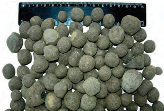
Рис. 1. Флюс обожженный магнезиально-известковый (ФОМИ)

Перед началом проведения испытаний были рассмотрены два варианта присадки флюса ФОМИ: