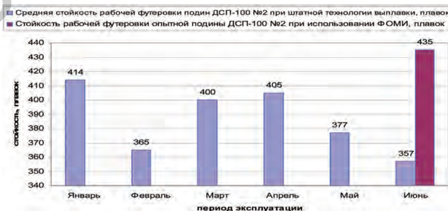
Рис. 2. Стойкость рабочей футеровки подины ДСП-100 № 2 за шесть месяцев 2012 г.

Из анализа результатов проведенной работы следует, что технологические показатели сравнительных кампаний и плавков с применением опытного материала по 3-й схеме (со средним расходом ФОМИ 1849 кг/плавку) сопоставимы. Негативного влияния присадки опытного материала на технологические показатели выплавки стали не выявлено, при этом за счет снижения периодичности операций по уходу за футеровкой в среднем на 0,8 плавки сократилось время от выпуска до выпуска, а также снизился расход заправочных материалов. Таким образом, длительность основных технологических