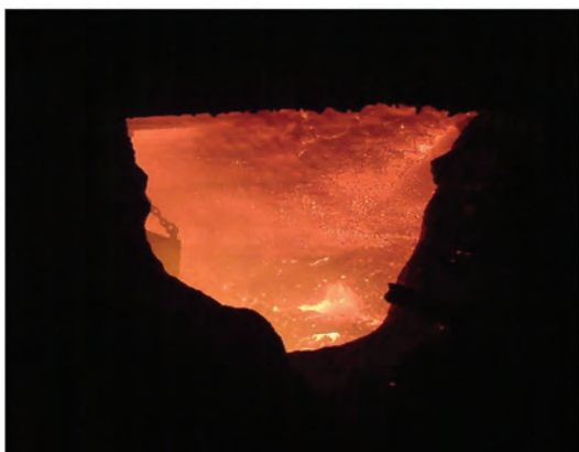
Рис. 4. Футеровка рабочего слоя стен закрыта гарнисажным слоем

операций и операций по уходу за футеровкой сократилась на 0,7–1,4 мин/плавку.