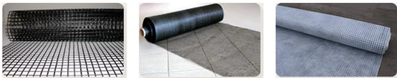
Рис. 1. Примеры геосеток, применяемых для армирования грунтов

Геосетка может производиться различными способами: литьём, переплетением нитей или соединением узлами. Геосетка может пропитываться специальным полимерным составом, что обеспечивает стабильность структуры и высокую разрывную нагрузку геосетки.