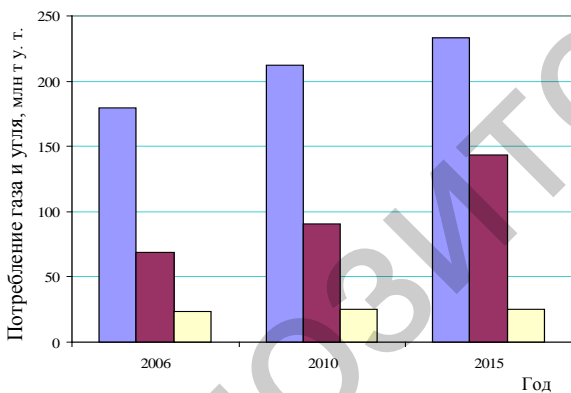
Рис. 3. Динамика потребления газа и угля в России и Беларуси с прогнозом до 2015 г.: ■ – газ в России; ■ – уголь в России; □ – газ в Беларуси