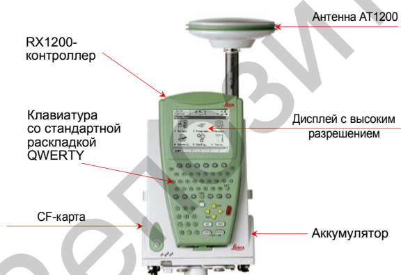
Рис. 3. GPS-приемник Leica GX1230

GPS-наблюдения на геодинимических реперах в районе Краснослободского разлома выполняли сетевым методом. Использовали режим измерений «Статика». Длину эпохи наблюдений устанавливали равной 30 с, выбирали исходя из рекомендаций фирмы-изготовителя GPS-оборудования и технических возможностей оборудования. Угол возвышения спутников, с которых принимали сигналы (угол засечки), устанавливали равным 10–15 град. (Угол 10 град. использовали на четвертом репере для увеличения числа принимаемых спутников, поскольку на этом репере условия приема GPS-сигналов были далеки от идеальных.) С целью исключения искажений, вносимых расположением фазового центра GPS-антенны, на каждый пункт сети всякий раз устанавливали один и тот же GPS-приемник и ориентировали его всегда в одном и том же направлении.