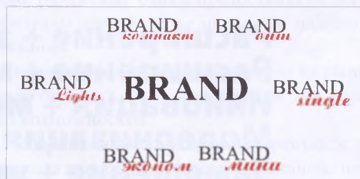
Рисунок 1. Экономия и объем упа- ковки

Последний вариант непрост, здесь можно допустить ряд ошибок, но от фатальной неудачи отлично страхует одно четкое правило: рассматривать назначение существующих продуктов и придумывать новый с позиции изменившейся жизни потребителя, с позиции его личности, набора ситуаций, с которыми он сталкивается. И тогда вы сможете избежать массу глупых идей и предложений, которые вполне попадают под определение «правильного позиционирования» и др.