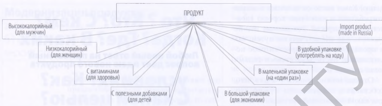
▲ Рисунок 2. Рынок продуктов питания

Рынок продуктов питания сложен и разнообразен, универсальные «рецепты счастья» здесь невозможны. Но предложенные 4 варианта изменения и дополнения продуктовой стратегии покрывают в целом все товарные категории, кроме сильнобрендированных – водки, пива и сигарет. Впрочем, какие-то варианты можно найти даже в них, хоть конкуренция зашкаливает и все явные идеи давно придуманы. Прочие же категории позволяют использовать несколько вариантов как в комплексе, так и по отдельности. Глав-