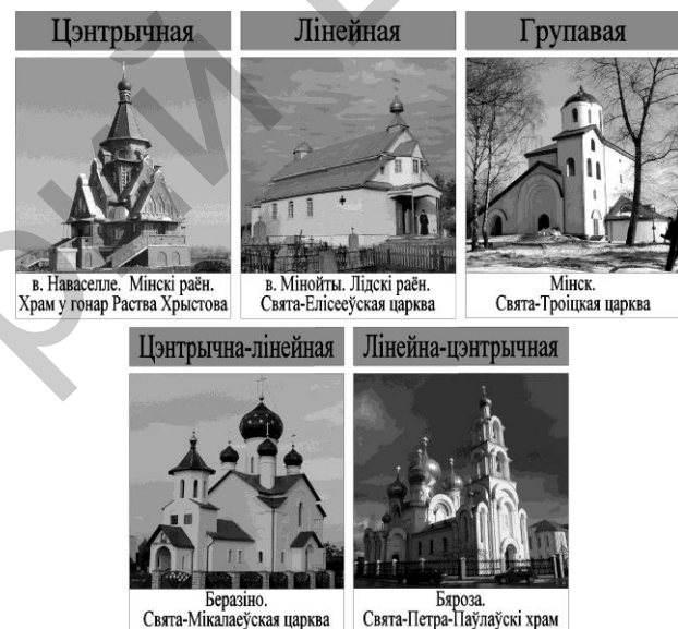
Малюнак 3 – Варыянты кампазіцый

і раўнавага, пірамідальнасць (в. Наваселле. Мінскі раён. Храм у гонар Раства Хрыстова); 2) спалучаюцца 2 гарызантальных і 5 вертыкальных восяў, параўнальна з 1 варыянтам, кампазіцыя атрымлівае больш складаную пабудову і характарызуецца прасторавасцю, іерархічнасцю аб’ёмаў. Выкарыстоўваюцца як дынамічныя, так і статычныя рашэнні (п. Краснасельскі. Ваўкавыскі раён. Свята-Георгіеўскі храм); 3) аб’ядноўвае 4 гарызантальных і 5 вертыкальных восяў. Па асноўным якасцям супадае з 2 варыянтам з той розніцай, што ў асноўным ужываецца статычная кампазіцыя (Мінск. Храм у гонар абраза Божай Маці “Мінскі”).