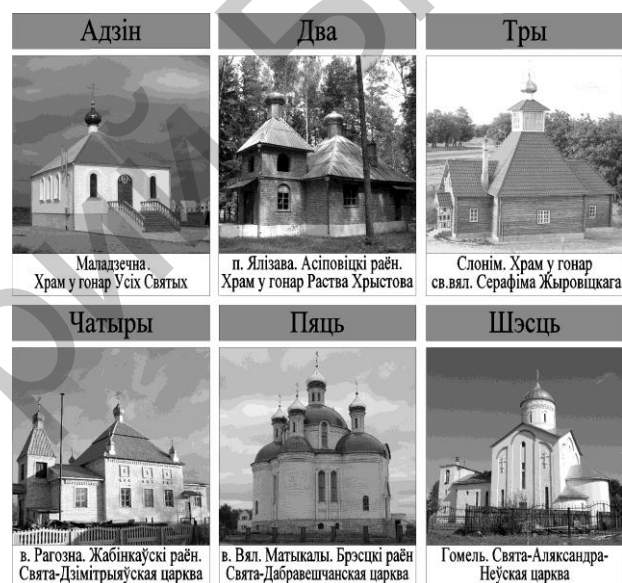
Малюнак 4 – Колькасць аб’ёмных элементаў

гарызантальных і вертыкальных вояў, аб’ёмаў. Для дадзенай кампазіцыі характэрны дынаміка і кантрастныя адносіны паміж элементамі, у тым ліку высотныя. У сувязі з адсутнасцю відавочнага строю і сістэмнасці, складанасцю з’яўляецца стварэнне гарманічнай, ураўнаважанай кампазіцыі, неабходнай пры ўзвядзенні праваслаўных храмаў, што абумоўлівае яе рэдкае выкарыстанне ў сучаснай практыцы. Нягледзячы на гэта, пры прафесійным рашэнні семантычных і кампазіцыйных задач могуць стварацца арыгінальныя вобразныя рашэнні (Мінск. Свята-Троіцкая царква).