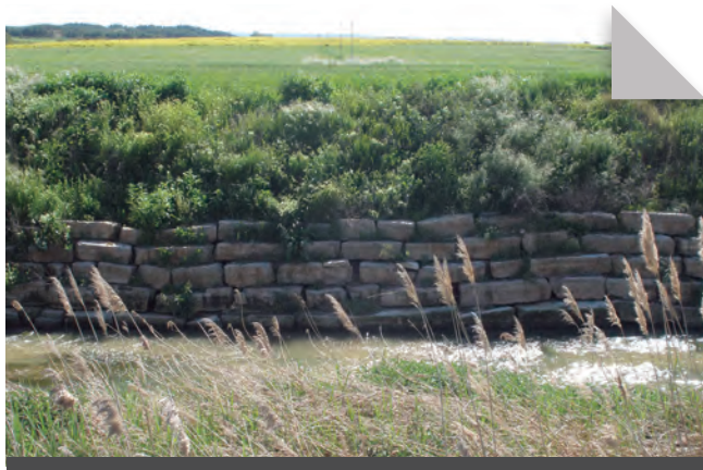
Fig. 2 - Alguns dels trams mitjans de la clamor Amarga presenten parts canalitzades i petites rescloses. A la imatge, grans carreus canalitzant el llit de la clamor. Agost 2010. Rafel Folch Monclús.

socials i rastres i evidències de l'esdevenir històric. Anem tot seguit a veure doncs els principals elements que permeten descriure aquest territori fronterer, tot intentant esbossar un senzill relat social i de geografia humana d'aquest indret acompanyats en tot moment per la remor de fons de la clamor. En primer lloc, però, aturem-nos un moment en el seu topònim.