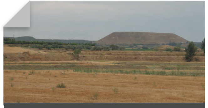
Fig. 7 - Imatge del tossal del Metxut, de 366m., al municipi d'Almenar, prop del naixement de la clamor Amarga, exemple dels típics i aspres turons o tossals segriàncs. Agost 2010. Rafel Folch Monclús.

de poder, i en certa mesura també la diversitat cultural i ideològica, que es manifesten i s'estableixen en el pla social (Lefebvre 2013). El paisatge respon a una doble arquitectura social. Una arquitectura és de caire tècnic i científic: la de l'anàlisi de la relació entre els medis físic i social, la de la planificació territorial, la de la protecció del medi ambient, i porta aparellada els valors de la contemplació analítica i estètica, juntament amb les nocions del gaudi i l'oci. 6