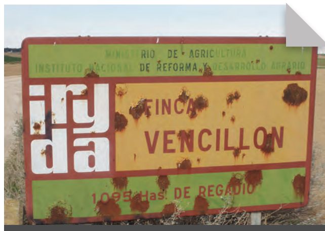
Fig. 9 - Vell cartell de l'Institut Nacional de Reforma y Desarrollo Agrario (IRYDA), testimoni d'una altra època, molt a prop de la població de Pla de la Font, al límit amb el terme municipal de Vencilló, a la comarca de la Llitera. Agost 2010. Rafel Folch Monclús.

Dels primers assentaments datats al voltant del 1.000 aC, passant per la colonització ibera, la posterior romanització, la presència sarraïna, les subsegüents reconquestes cristianes i el domini dels senyors feudals de l'edat mitjana, tots i cadascuna han deixat la seva empremta històrica, encara perceptible en algunes de les construccions arquitectòniques que es conserven en diversos turons de la zona. 7 I igual que contenen tot el ventall de la varietat històrica que ha habitat aquest territori, el seu caràcter eixut i desèrtic fa dels tossals uns espectadors privilegiats del que devia haver estat aquest ampli territori estacionalment humitejat per la clamor Amarga. Alguns dels principals tossals testimoni que voregen la clamor en el seu trànsit fins al Cinca són el tossal del Metxut, a Almenar, el tossal de l'Ametller i el Vilot, a Almacelles, el tossal de Vallbona prop del Torricó, el tossal de Cabanes, a la vora de la població del Pla de la Font, tots entre els 200 i els 400 m d'alçada, i els diversos turons de la part baixa de la clamor, a la zona de les partides dels Montcalvos i els Abellars, ja amb uns relleus més sinuosos i agrests, prop del poble de Saidí.