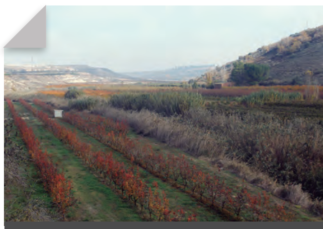
Fig. 5 - Mosaic de colors tardorencs en els conreus de la vall que conforma la clamor Amarga, prop ja de la seva desembocadura. Novembre 2009. Rafel Folch Monclús.

i les condicions físiques que el conforma. Qui sap si la millor definició de clamor ens la proporciona Joan Coromines, quan proposa que en el sentit etimològic de «remor clamorosa d'una avinguda d'aigua», el mot clamor és especialment comú al Baix Aragó i també a la Llitera, al Segrià i a l'Urgell, especialment d'aquells «corrents d'aigua no ben bé continus però de gran abundor en temps de pluges». 3 Si és així, cal prendre el terme en el seu sentit literal, és a dir, en el sentit d'un soroll, en el sentit de l'agitació que provoca l'arribada de la tempesta, que és una promesa de salvació, en el sentit de la fressa i el borbolleig que acompanya l'aigua desbocada en una zona on impera el silenci d'una terra seca i esquerdada.