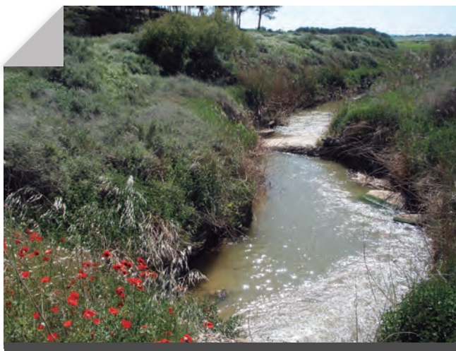
Fig. 3 - La clamor Amarga en el seu curs mitjà. Maig 2009. Rafel Folch Monclús.