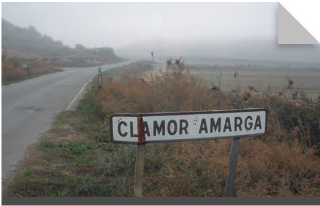
Fig. 6 - Vell i rebregat cartell de la clamor situat entre les partides de les Bufarres i els Abellars, al pont de la carretera local que uneix la població de Saidí amb el llogarret de la partida de Vallmanya (municipi d'Alcarràs). En aquest punt, ja a la comarca del Baix Cinca, la clamor que baixa per la vall de Vallmanya desemboca en la clamor Amarga. Novembre 2009. Rafel Folch Monclús.