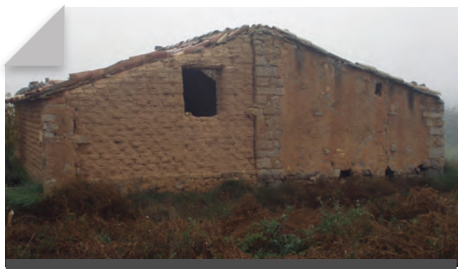
Fig. 8 - Petit mas fet de fang i pedra enmig d'un terreny erm, prop de la clamor. Aquests tipus de construccions són encara característics de la zona, tot i que el seu abandonament i la seva substitució per altres tècniques constructives i altres materials fan que es trobin avui al límit de la seva desaparició. Novembre 2009. Rafel Folch Monclús.

Dels primers assentaments datats al voltant del 1.000 aC, passant per la colonització ibera, la posterior romanització, la presència sarraïna, les subsegüents reconquestes cristianes i el domini dels senyors feudals de l'edat mitjana, tots i cadascuna han deixat la seva empremta històrica, encara perceptible en algunes de les construccions arquitectòniques que es conserven en diversos turons de la zona. 7 I igual que contenen tot el ventall de la varietat històrica que ha habitat aquest territori, el seu caràcter eixut i desèrtic fa dels tossals uns espectadors privilegiats del que devia haver estat aquest ampli territori estacionalment humitejat per la clamor Amarga. Alguns dels principals tossals testimoni que voregen la clamor en el seu trànsit fins al Cinca són el tossal del Metxut, a Almenar, el tossal de l'Ametller i el Vilot, a Almacelles, el tossal de Vallbona prop del Torricó, el tossal de Cabanes, a la vora de la població del Pla de la Font, tots entre els 200 i els 400 m d'alçada, i els diversos turons de la part baixa de la clamor, a la zona de les partides dels Montcalvos i els Abellars, ja amb uns relleus més sinuosos i agrests, prop del poble de Saidí.