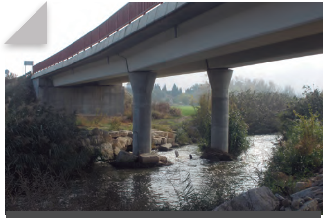
Fig. 10 - Pont sobre la clamor a la carretera A-1234 que uneix les poblacions de Saidí i Fraga. Pocs metres més enllà la clamor desguassa al riu Cinca. Novembre 2009. Rafel Folch Monclús.

estava representat en el seu vocabulari) amb ell mateix o amb els altres pagesos en el marc d'una economia d'escala local o regional; avui, però, els camps que reguen la clamor Amarga s'enfronten a empresaris que tenen els seus despatxos a l'altra punta del món. La industrialització del camp és ja una realitat, també aquí. És una mena d'absorció empresarial de tot el que té a veure amb els processos de producció, distribució i consum dels productes agrícoles i tot allò que hi és associat: la propietat de la terra, les seves formes d'explotació i les relacions socials que se'n deriven. Veurem com totes aquestes dinàmiques socials i econòmiques van prenent cos en el territori.