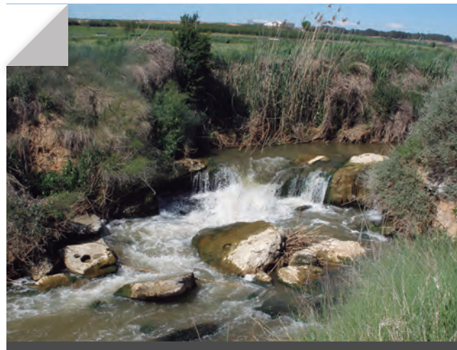
Fig. 4 - En alguns punts del recorregut, el cabal elevat de la clamor ens recorda una mena de riu d'aquesta part de la Franja de Ponent. Maig de 2009. Rafel Folch Monclús.

aquest nom apareix també referenciada en la cartografia de la zona, a més de com la clamor d'Almacelles, imagino que per la proximitat del curs de la clamor amb aquest important nucli de població del Segrià. La composició del sòl d'aquesta plana al·luvial, històricament, ha contingut altes concentracions de carbonats i sulfats càlcics que, en entrar en relació amb el clima sec predominant en la zona i amb els cursos d'aigües estacionals i la formació de zones pantanoses fruit dels drenatges naturals, provocava una elevada salinització de la terra, fenomen tradicionalment ben conegut per la pagesia local. Així doncs, hem de suposar que l'aigua que transporta la clamor conté, encara avui, una alta concentració de sals provinents de les terres que humiteja, històricament terres eixutes i molt salobroses. D'aquí l'amargor de la seva aigua, però qui sap si aquesta amargor no serà també l'expressió d'una dimensió social, ara que l'activitat agrícola de la zona va davallant vers una crisi profunda que contrasta amb l'esplendor agrícola que visqué la societat d'aquests indrets especialment al llarg de la segona meitat del segle passat. Més endavant ens aturarem en aquestes consideracions. Abans, però, veiem breument els possibles significats del terme clamor .