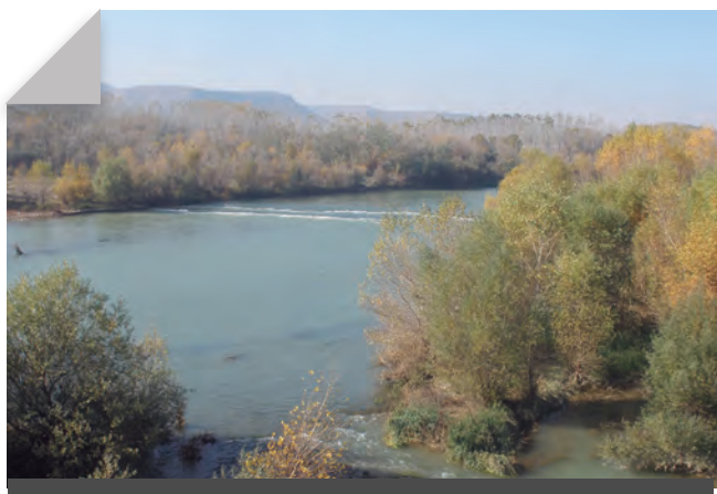
Fig. 11 - Desembocadura de les aigües de la clamor Amarga al riu Cinca, ja a la comarca del Baix Cinca. Novembre 2009. Rafel Folch Monclús.

urbans (els pobles de colonització o pobles de colonos , tal com popularment se'ls ha conegut), en un gran moviment migratori sense precedents promogut directament pel govern de l'època i que afectà principalment les províncies del sud i de l'oest de l'Estat espanyol. Així, durant els anys quaranta es van construir els nuclis de repoblació agrícola de Gimenells, Sucs, el Pla de la Font i Vensilló, pobles que es van aixecar en un territori que no havia deixat de perdre població pràcticament des de meitats del segle XVII. Gimenells i el Pla de la Font es constituí l'any 1991 com a municipi independent; Sucs, juntament amb el caseriu de Suquets, és una entitat municipal descentralitzada que forma part del municipi de Lleida; i Vensilló, que és també municipi independent, és localitzat a la Llitera, ja al llindar amb la comarca del Baix Cinca.