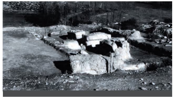
Fig. 7: Excavacions a Raimat II, Fons del Servei d'Arqueologia, Ajuntament de Lleida, imatge 4.

Fotografia N-5. Amb el peu: «Algunes de les peces trobades a Raymat (Nadal)». La fotografia empra com a fons una tela estampada amb motius florals que cobreix un suport i el fons dret, però el fons esquerre és una zona fosca. Al centre hi destaca el gerro sencer de ceràmica