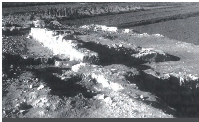
Fig. 5: Excavacions a Raimat II, Fons del Servei d'Arqueologia, Ajuntament de Lleida, imatge 1.

Fotografia N-1. Amb el peu: «Vista de conjunt en la part sur de l'excavació de J. NADAL». S'hi pot apreciar una zona excavada en extensió amb un front en angle encara no afectat prop de la part inferior esquerra, delimitat per un llarg i potent mur longitudinal, en part ja excavat per aquest costat i totalment en el contrari. En aquest extrem inferior dret es veu, en penombra, un angle format per un segon mur perpendicular degradat en la seva corona de forma esglaonada, però que conserva moltes filades; aquest espai sí que ha estat buidat en profunditat. Darrere d'aquest angle és possible deduir-hi un espai estret (de circulació?), més enllà un nou mur perpendicular il·luminat pel sol, que conserva varies filades i que no està disposat exactament en línia amb el primer esmentat, darrere seu hi ha dos murs perpendiculars, però les estances no han estat excavades; darrere d'aquestes es veu una plataforma de terra, alhora extrem d'una petita altura que sobresurt sobre uns camps plans formats per feixes allargades (fig. 5). La vista podria ser en sentit contrari i en un altre moment d'excavació a les fotografies T-1 i T-2.