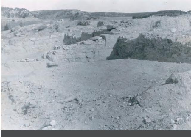
Fig. 1 - Excavacions a Raimat II, Fons Tarragó, imatge 1. Font: Servei d'Audiovisuals de l'Institut d'Estudis Ilerdencs.

fins a la base d'un altre gran bloc rectangular horitzontal, carreus que semblen acabats amb encoixinat i repicat oblic; la tècnica constructiva recorda l' opus africanum (ADAM 2002: 130–132). La conservació dels murs paral·lels és esglaonada i variable, segurament l'extrem de les habitacions es veié afectat per l'erosió natural; en la zona il·luminada sembla aflorar la base arrasada d'una estructura perpendicular (de tanca?), coberta en la cantonada en primer terme per un caminet de terrera. La foto confirma que l'excavació havia estat extensiva i completa, sense deixar-hi testimonis interns (fig. 1).