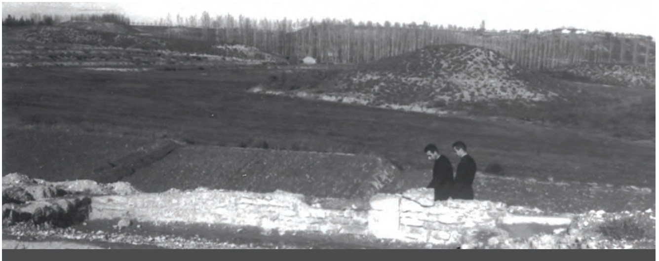
Fig. 6: Excavacions a Raimat II, Fons del Servei d'Arqueologia, Ajuntament de Lleida, imatge 2. A l'esquerra, J. Nadal i, al seu costat, A. Conesa.

Fotografia N-3. Sense peu, és la imatge completa anterior i el mateix sector vist en la Fotografia N-1. En primer terme hi ha una zona amb terra i pedres petites que afloren, com d'abocament i com si haguessin estat rentades per pluges, al seu darrere una llenca horitzontal clara recorda un aflorament de la roca natural, darrere destaca en alçada la gran paret longitudinal il·luminada comentada en N-1, formada per filades de pedres planes, entre tres i set, i en un punt amb el reforç d'un gran bloc rectangular dret, nova evidència d' opus africanum .