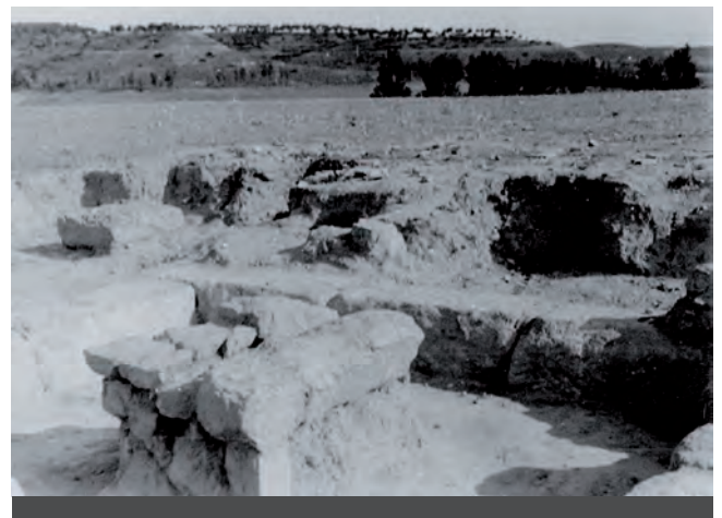
Fig. 4: Excavacions a Raimat II, Fons Tarragó, imatge 5.

Fotografia T-5. L'objectiu ha girat encara més al sud i la serra es veu ara en una altra perspectiva. En primer terme s'observa en detall el més allunyat dels basaments anteriors, amb una plataforma rectangular de grans pedres sustentades per unes altres de verticals i tal vegada terra; en un plànol mitjà s'identifica l'angle interior de l'estança, formada per tres murs d'una filada de grans carreus rectangulars. Més al fons s'hi poden veure fronts de l'excavació, espais excavats i un gran bloc de pedra isolat (fig. 4).