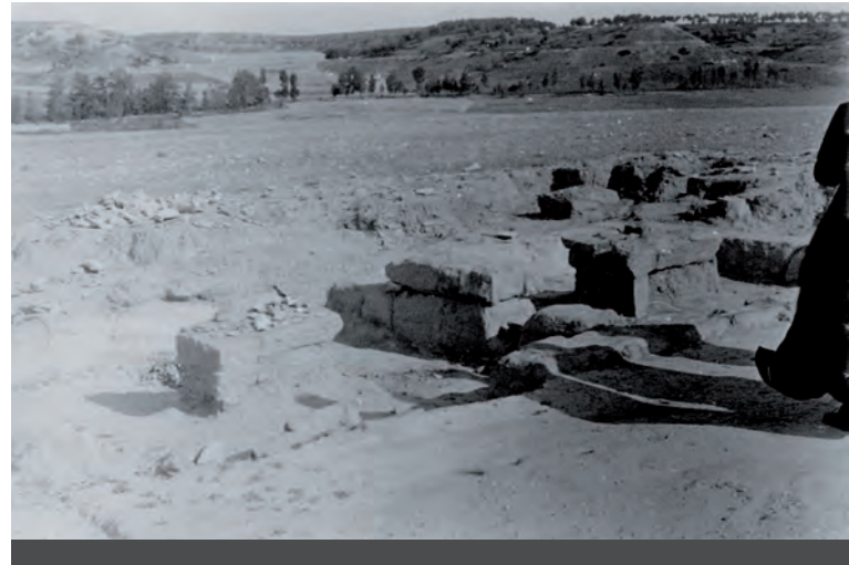
Fig. 3: Excavacions a Raimat II, Fons Tarragó, imatge 4.

Fotografia T-4. De nou és possible situar el paisatge del fons i sembla com si l'objectiu hagués girat una mica al sud; entre els tossals i el camp erm de la imatge anterior es veuen alguns arbres. En l'extrem dret de la fotografia apareix el perfil del religiós anterior i les ombres de (tres?) persones, la seva llargada i posició indiquen que les fotografies han estat preses avançat el dia. L'objectiu s'ha desplaçat una mica i ha fotografiat allò que estaven contemplant les dues persones de la fig. 2: es tracta de dos basaments quadrangulars de dues filades de carreus situats al centre de dues petites estances també quadrangulars, formades per una filada de carreus i separades per un mur carreuat conservat en una o dues filades. El basament de l'esquerra apareix coronat pel que semblen troballes; al seu darrere, i ja fora de l'excavació, hi ha un muntet, no està clar si de pedres o de ceràmica; en l'angle del fons a la dreta s'observen carreus i estructures en una zona més confusa (fig. 3).