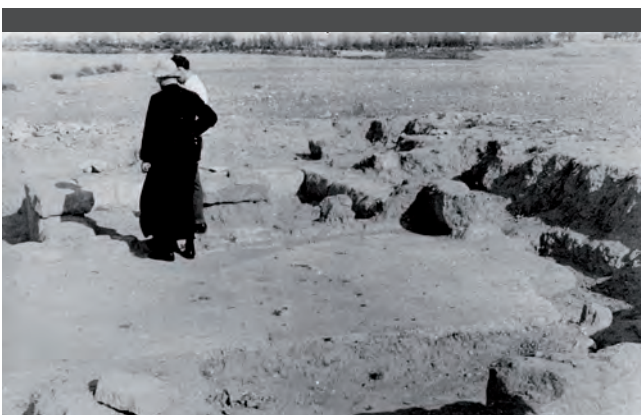
Fig. 2: Excavacions a Raimat II, Fons Tarragó, imatge 3.

Fotografia T-4. De nou és possible situar el paisatge del fons i sembla com si l'objectiu hagués girat una mica al sud; entre els tossals i el camp erm de la imatge anterior es veuen alguns arbres. En l'extrem dret de la fotografia apareix el perfil del religiós anterior i les ombres de (tres?) persones, la seva llargada i posició indiquen que les fotografies han estat preses avançat el dia. L'objectiu s'ha desplaçat una mica i ha fotografiat allò que estaven contemplant les dues persones de la fig. 2: es tracta de dos basaments quadrangulars de dues filades de carreus situats al centre de dues petites estances també quadrangulars, formades per una filada de carreus i separades per un mur carreuat conservat en una o dues filades. El basament de l'esquerra apareix coronat pel que semblen troballes; al seu darrere, i ja fora de l'excavació, hi ha un muntet, no està clar si de pedres o de ceràmica; en l'angle del fons a la dreta s'observen carreus i estructures en una zona més confusa (fig. 3).