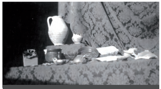
Fig. 8: Ceràmiques trobades a Raimat II, Fons del Servei d'Arqueologia, Ajuntament de Lleida.

comuna esmentat en la carta comentada, al seu costat hi ha un vaset també comú mancat de la vora. En la filera inferior i d'esquerra a dreta, s'hi observa un vas molt sencer de terra sigil·lada decorada, possiblement una TSH forma Drag. 30; al seu davant hi ha una llàntia ceràmica de perfil, també sencera; al darrere i a tocar amb la sigil·lada anterior, n'hi ha una altra de més petita i llisa, que sembla reconstruïda i amb un perfil sencer, tal vegada una TSH Drag. 27; al seu davant hi ha un objecte que no identifiquem, darrere li segueix un plat de ceràmica sigil·lada molt sencer i disposat per mostrar l'interior; continuen dos objectes rectangulars de tonalitat clara (fragments de marbre?, estuc?); segueix el que semblen un coll i una nansa gruixuda; i tanca el conjunt un fragment que sembla pintat del tipus ibèric amb una banda ampla (fig. 8).