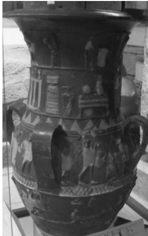
Fig. 1. Vaso de cerámica que muestra la celebración de una boda. Inandik, mediados del siglo XVII aC. Museo de las Civilizaciones Anatólicas. Ankara.

El día de la ceremonia nupcial (Fig. 1) una comitiva seguía a la novia hasta el punto de encuentro con su prometido y una vez juntos los contrayentes se realizaban los diferentes rituales del enlace (Fig. 2): la entrega de regalos, los músicos, los rituales de ofrendas, la libación de agua, los ruegos de protección a los dioses y el levantamiento del velo de la novia, finalizando, como hoy día, en un banquete festivo para los asistentes al enlace.