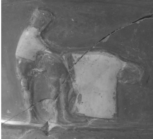
Fig. 3. Acto sexual. Detalle del vaso de cerámica de Inandik.

La representación de la cerámica de Inandik incluye hasta la consumación del matrimonio (Fig. 3):