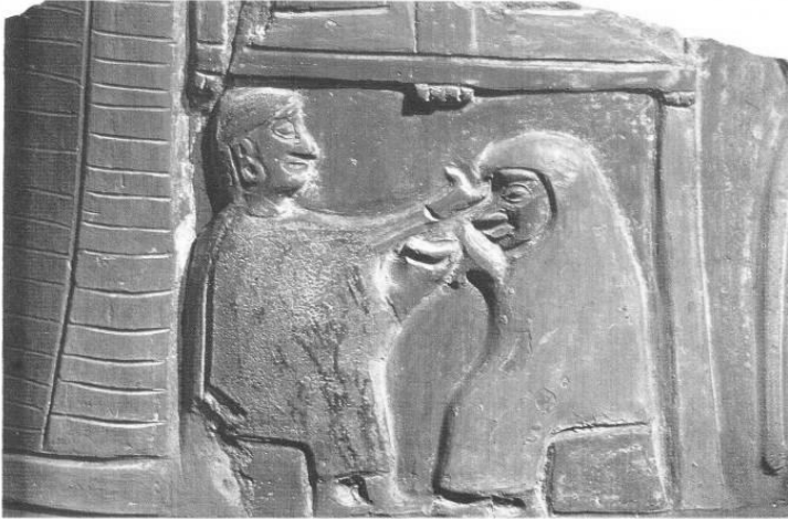
Fig. 4. Bodas místicas, vaso de cerámica de Bitik, siglo XIV aC. Museo de las Civilizaciones Anatólicas. Ankara.

La libación de agua y el levantamiento del velo se representa en la boda mística escenificada en la vasija de Bitik 15 (Fig. 4) donde se ve a una pareja sentada uno frente a otro, ante lo que parece el marco de entrada de una construcción.