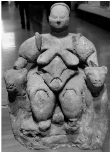
Fig. 5. Diosa-madre dando a luz sentada en un trono custodiado por un león a cada lado. Barro cocido. Catal Hüyük, VII-VI milenio aC. Museo arqueológico de Ankara.

La procreación es un acto fundamental, no sólo por razones emocionales, sino también porque los padres cuentan con la ayuda de esa fuerza de trabajo y esperan de sus hijos que los apoyen en la vejez y que se ocupen de sus rituales funerarios y las oraciones en su memoria. Es por ello que la prole se considera una bendición divina, mientras su falta se entiende como un castigo, por ello numerosos textos religiosos y de rituales mágicos buscan la fertilidad, impedir los abortos involuntarios, contrarrestar la infertilidad debida a un hechizo maléfico, etc. De ahí que los códigos legales del Próximo Oriente Antiguo se preocupen de proteger a las mujeres embarazadas de las posibles agresiones que puedan sufrir.