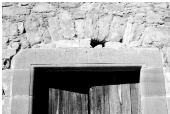
Llinda de la porta d'ingrés amb arc de descàrrega al damunt

En el moment de confeccionar la fitxa sobre aquesta capella, no vam poder veure el seu terra que, com la casa, es trobava també en procés de restauració.