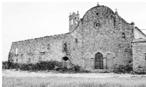
Façanes d'ingrés del convent i santuari

A l'esquerra de l'església s'obre la porta primitiva del convent i una sèrie de finestres petites que corresponen a les dependències agrícoles, de la mateixa manera que trobem una alternança de finestres i finestres més petites que corresponen a la zona d'habitació del convent. L'edifici és de planta rectangular (ample 26,30 m x llarg 32,60 m aprox.).