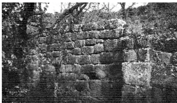
Interior del mur nord

Edifici d'una sola nau, de planta rectangular amb absis semicircular orientat a llevant (llargada total: 11,50 m x amplada: 3,4 m x gruix dels murs: 0,9 m). Actualment es troba en avançat estat de ruïna, sense coberta, amb alguns trams de murs totalment o parcialment enderrocats (sobretot els murs sud i oest).