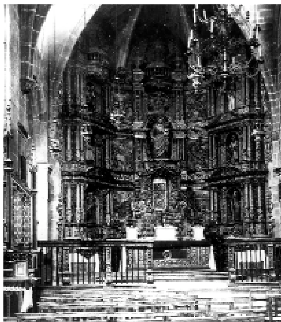
Retaule de l'altar major destruït el 1936

Pel que fa a la iconografia, era un retaule de tipus marià amb la imatge de Maria al centre, sota de la qual hi havia un imponent sagrari que aniria agafant un lloc preeminent en els retaules barrocs amb motiu de l'exaltació eucarística. Els carrers laterals presentaven sengles fornícules amb les imatges de Sant Pere, Sant Josep i Sant Antoni de Pàdua a la dreta, i de Sant Pau, Sant Ermengol i Sant Sebastià a l'esquerra. A la resta del retaule hi havia representats els misteris del Rosari, culte dominicà per excel·lència i propugnat per la cre-