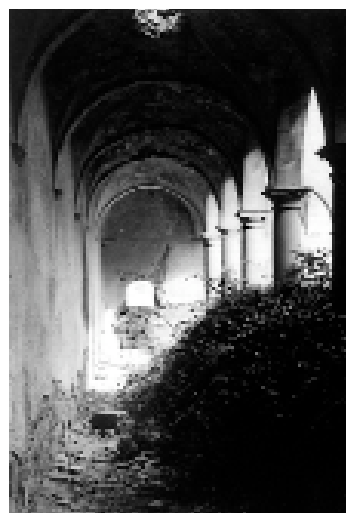
Aspecte del claustre en una imatge dels anys seixanta