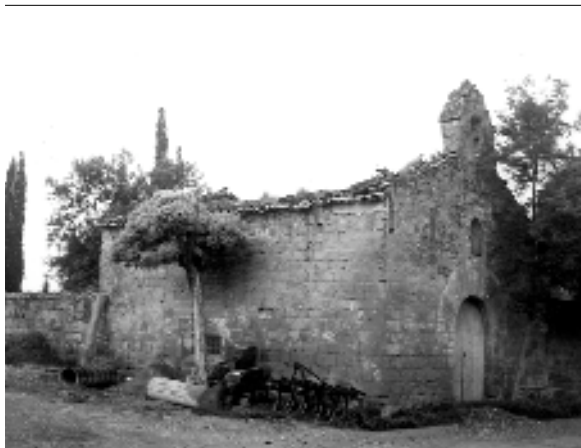
Imatge de la capella als anys seixanta

Edifici d'una sola nau de planta rectangular i absis semicircular, de dimensions notables per tractar-se d'una capella (12,20 m x 8,40 m). Orientada de nord a sud.