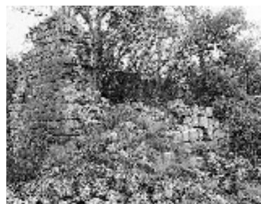
Exterior dels murs sud i oest

Al mur oest, tot i trobar-se parcialment enderrocats, possiblement hi hauria una finestra cruciforme, avui pràcticament desapareguda com a conseqüència de l'enderroc.