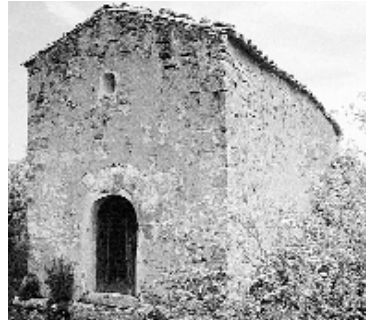
Façanes sud i oest

És un petit edifici d'una sola nau, de planta rectangular (10 x 4,25 m) i coberta a doble vessant, orientat en sentit est-oest. Els murs presenten arrebossat de calç i arena que recobreix, tal com mostra algun sector, uns murs bastits a base de carreus.