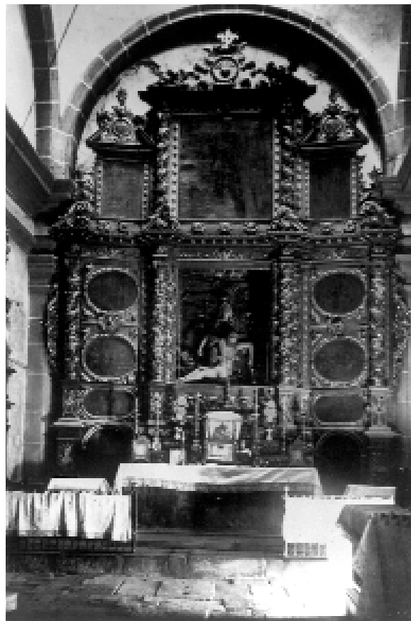
Retaule de la capella dels Dolors, destruït l'any 1936 (Arxiu fotogràfic de la Casa Museu Duran i Sanpere)

En fer referència a l'altar major es parla també de "son retaule d'escultura dorat", fent referència al magnífic retaule de mitjans segle XVII que fou destruït