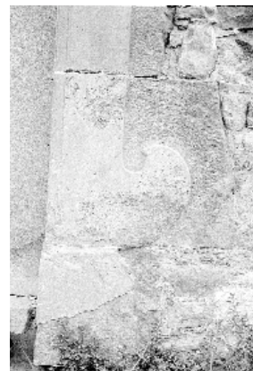
Decoració del muntant de la porta d'ingrés