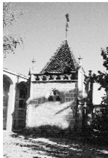
Aspecte actual del panteó

Pel que fa al mausoleu objecte del nostre estudi, és de planta quadrangular (2,90 m aprox. per cada costat) i presenta aparell de carreus de pedra ben escairats amb junts remarcats. La façana amb la porta d'ingrés presenta els cantells rebaixats i flors esculpides a manera de botons. La porta està coronada per un gablet triangular i amb treball de la pedra a manera de traceria gòtica, que també s'observa en les finestres semicirculars de les parets laterals. La part alta de l'edifici presenta un ampitador que recorre tot l'edifici en planta, decorat a manera de claustre. Finalment, el