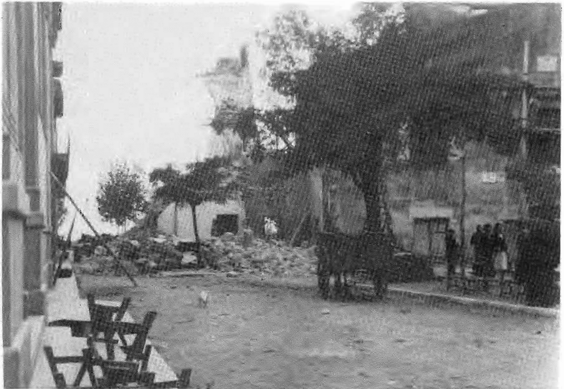
Fig. 8. L'aspecte més sinistre de la guerra en la vida de cada dia dels guixolencs l'oren els bombardeigs. El 22 de gener de 1938 l'aviació italiana bombardejà l'edifici municipal i la plaça. Dotze veïns hi moriren.

El 22 de gener de 1938, a dos quarts de dotze del matí, l'aviació «nacional» descarregava les seves bombes sobre l'edifici municipal i la plaça. Dotze veïns hi moriren.