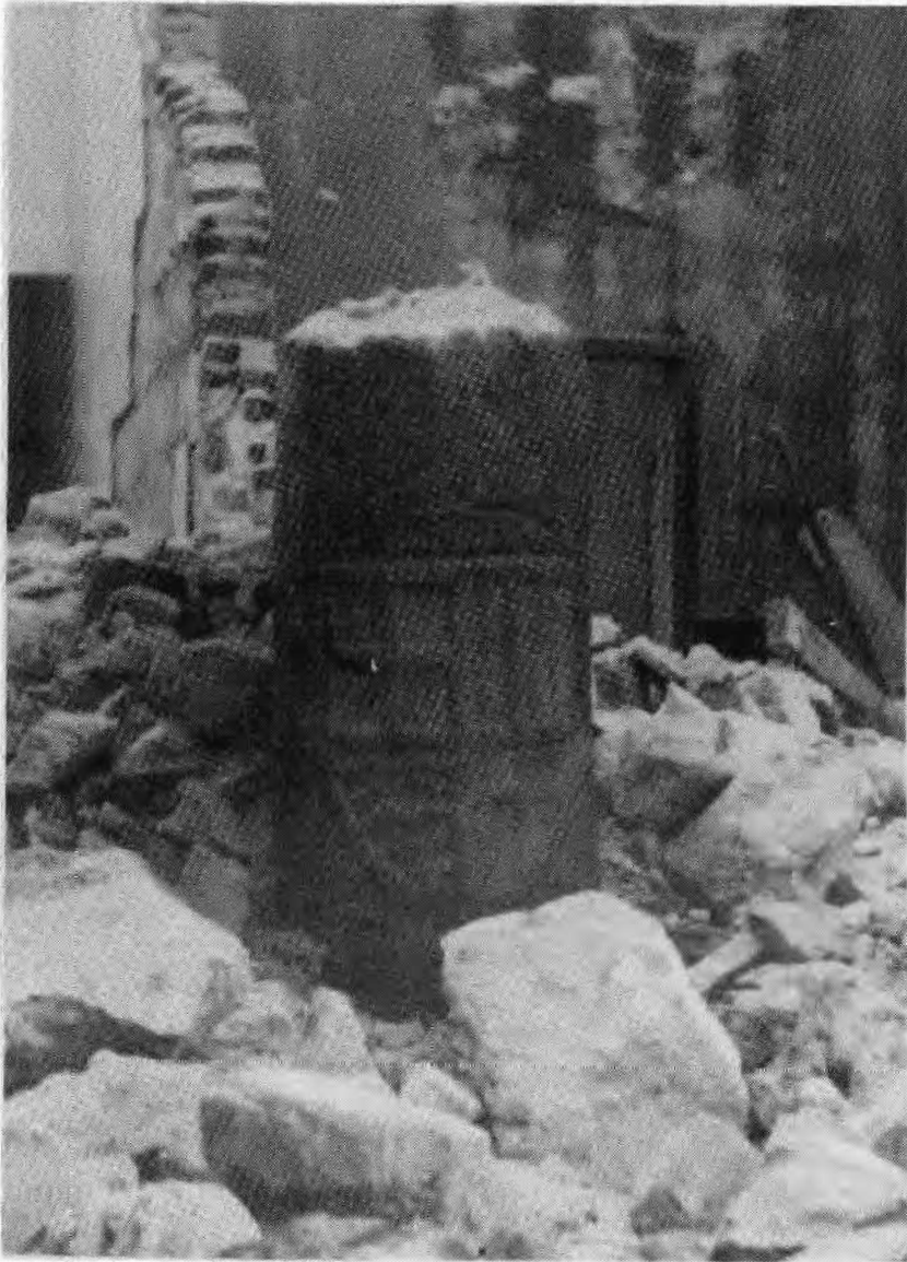
Fig. 9. Detall de l'Ajuntament ensorrat per les bombes; restà en peu l'antigua columna de pedra amb l'escut esculpit, i que avui es troba adherida a l'actual edifici del Consistori.