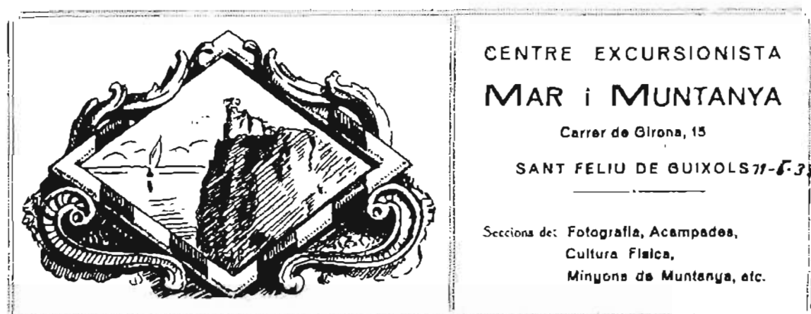
Fig. 2. El Centre Excursionista Mar i Muntanya, entre altres moltes associacions, promovia la cultura i l'esplai entre el poble.