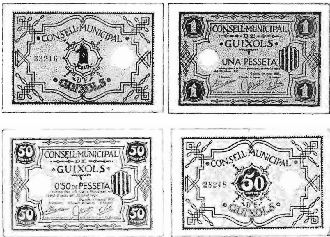
Fig. 6. Paper-moneda d'una pesseta emès pel Consell Municipal de Guixols, en virtut de l'acord pres el 25 de febrer de 1937 (original facilitat per Joan Vilaret).

Molt aviat també el nou consistori hagué d'emetre paper-moneda d'una pesseta fins a la quantitat de cinquanta mil. Emissió que més tard es tornà a repetir (55) .