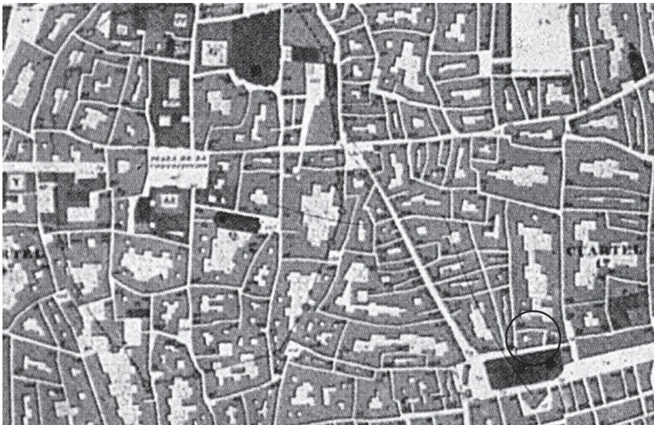
Figura 5. Detalle del plano de Barcelona del año 1842 dibujado por Josep Mas i Vila. En el ángulo inferior derecho se observa la antigua forma ligeramente curva de la calle Sant Antoni dels Sombrerers. Esta traza estaría señalando un fragmento del límite exterior del anfiteatro.

comprobable, como se ha comentado anteriormente, y que curiosamente los planos actuales no recogen. Cabe destacar también de este plano la curvatura que parece coger la calle Sant Antoni dels Sombrerers (fig. 5), curva cuya desaparición se puede atribuir a la remodelación moderna —posterior al plano— de los edificios que conforman esta calle. Por otro lado, en los planos de 1858 de Ramon Alabern y en el de 1862 de Francisco Coello y Maurici Sala se señala otra curva conformada por la línea de fachada de las casas de la calle Sombrerers antes de llegar a la calle Argenteria, curva que actualmente dibuja una anomalía con forma ligeramente angulosa en el trazado recto del resto de fachadas de la calle.