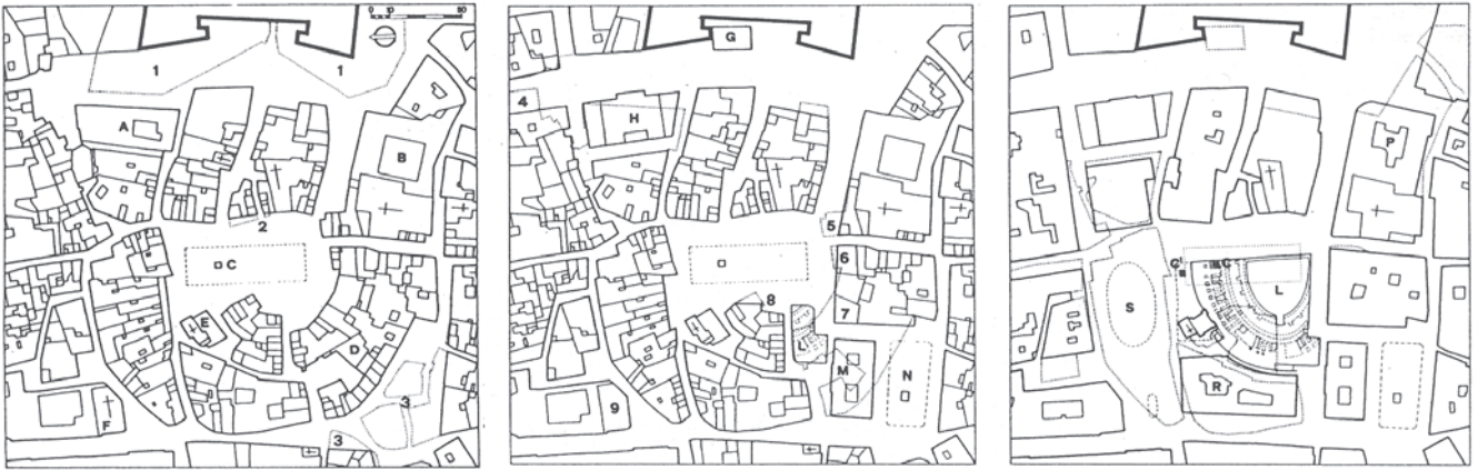
Figura 2. Plaza de S. Oronzo, en Lecce (según Fagiolo-Cazzato, en Cazzato 2000: 43). Su actual trama urbana, con claros indicios de radialidad, delataba la presencia de un anfiteatro.