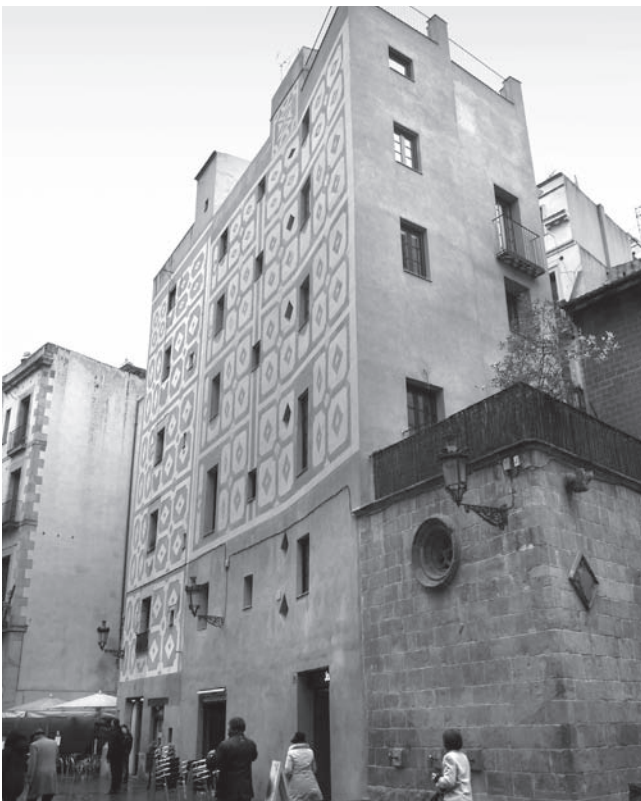
Figura 4. Edificio de la plaza Santa María, n. 7. Nótese la anómala curvatura de la fachada.