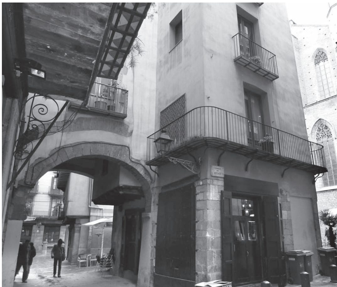
Figura 7. Arcos y estructuras abovedadas en la calle Caputxes.

calle, y bóvedas dels Encants, también desaparecidas, en la calle del Consolat del Mar; 33 aún en pie: dos bóvedas en la calle Arc de Sant Vicenç, dos bóvedas en la calle Volta dels Tamborets, una bóveda en la calle Caputxes, una bóveda en la calle Volta d'en Bufanalla, y otra en la calle Volta d'en Dusai. Es cierto que en otros puntos del casco antiguo de Barcelona se ha conservado bóvedas, pero no con la densidad que presentan las aquí expuestas. A ello se suma la noticia de galerías a modo de puente que circulaban entre Santa María y sus alrededores y que aún eran visibles a principios del siglo xx. 34 Si bien es conocido que estas bóvedas, galerías, arcos y puentes son propios del urbanismo de la Baja Edad Media, su especial concentración en la zona que estudiamos debe ser valorada en relación a la hipótesis que se está planteando, por lo que no se debería descartar la posibilidad de un origen antiguo para alguno de estos elementos arquitectónicos; 35 el