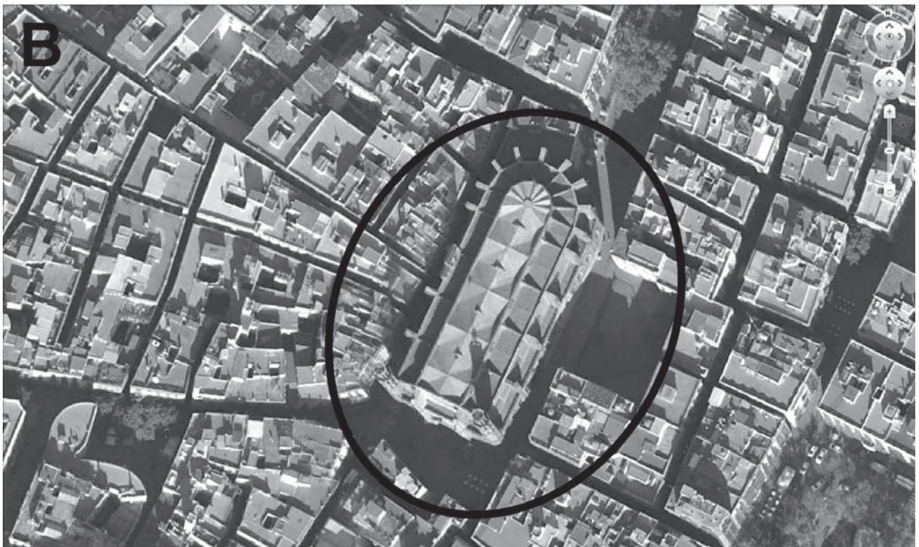
Figura 6. A) Rastros del posible anfiteatro de Barcelona en el urbanismo de la ciudad. En línea continua, las trazas del urbanismo actual; en discontinua, trazas reflejadas en planos del siglo XIX. B) Hipótesis de los límites exteriores del anfiteatro a partir de las trazas urbanas.