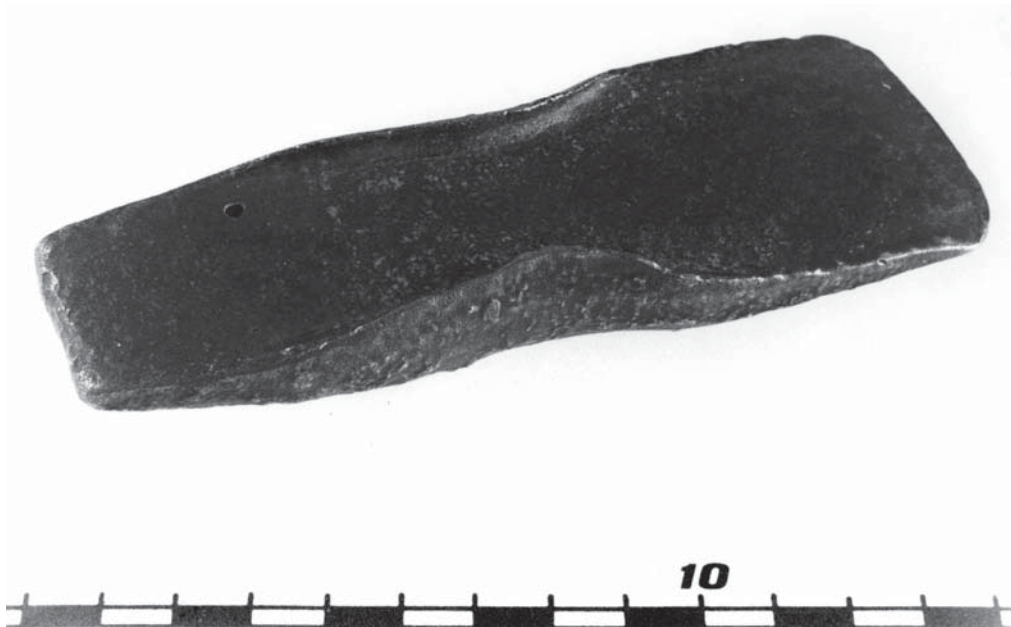
Fig. 2. Imatge de l'estat actual de la peça.