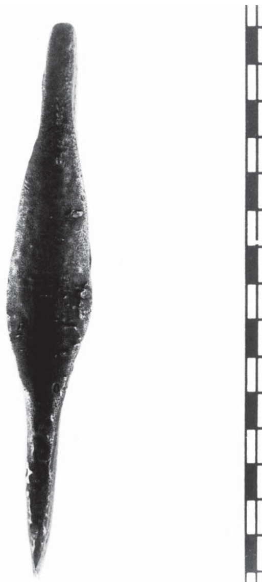
Fig. 3. Visió lateral de la destral mitjançant la qual es poden apreciar les característiques d'un dels vorells que li confereixen personalitat tipològica.