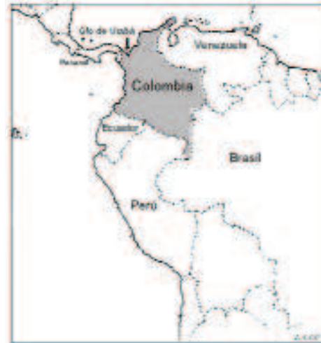
Figura.- 1. Mapa con algunos puntos de referencia regional. (Alzate 2006)

Santa María de la Antigua del Darién es un sitio arqueológico ubicado en territorio colombiano, en la esquina septentrional del continente Suramericano, en la región conocida como el Darién. La zona está rodeada al oriente por el Golfo de Urabá y al occidente por la Serranía del Darién. Esta serranía sirve como límite natural de frontera entre los países de Colombia y Panamá formando el conocido “Tapón del Darién”, que interrumpe la carretera Panamericana, pero que concentra una gran variedad de flora y fauna única en esta región. En el mapa anexo a este informe se podrá observar una ubicación geográfica general del sitio con relación al continente Suramericano.