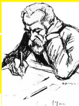
Gaudí, por Opisso (fotografía de la Real C tedra Gaudí)