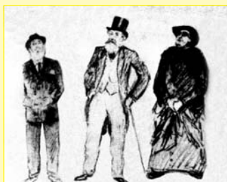
Gaud , Eusebi G uell y Torres i Bages (fotograf a de la Real C tedra Gaud )