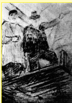
Matamala y Gaud  (fotograf a de la Real C tedra Gaud )

Con este t tulo, J. J. Navarro Arisa ha publicado, con motivo del A o Gaud  (1852-1926), una biograf a de quien fue “arquitecto genial e innovador, ciudadano de orden, catalanista, conservador y de una aferrada y casi obsesiva devoci n religiosa” . Pensamos que estas credenciales, unidas a la est tica singular y variada de su obra, justifican sobradamente que le dediquemos algunas portadas de Apunts durante este a o 2002, en el cual se conmemoran 150 a os de su nacimiento. Sorprende que, hace 50 a os, su centenario hubiese pasado pr cticamente desapercibido. Como afirma  scar Tusquets , “ nicamente lo reivindicaron cuatro especialistas y cuatro personas del mundo eclesi stico, mientras que para la mayor a de barceloneses era sin nimo de mal gusto y a nivel internacional era totalmente ignorado” . Sin duda, la cultura que se nos hab a inculcado despu s de la Guerra Civil, era responsable de estos desgraciados criterios est ticos, contrarios a todo aquello que se apartaba de la norma rutinaria de severa ra z integrista.