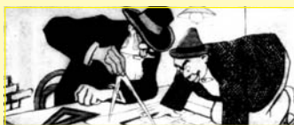
Gaud  y Opisso