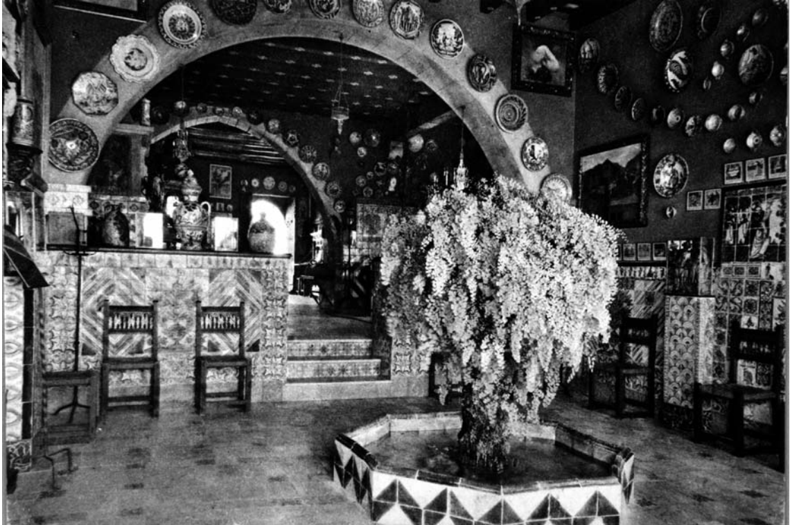
Fig. 8. Cambra del brollador del Cau Ferrat.

ring que adquirís la bandera de processó de l'any 1735 per exposar-la al saló del pis principal del Palau. El preu de compra rondà les 1.000 pessetes i el venedor donà més valor al marc que a la bandera. 66