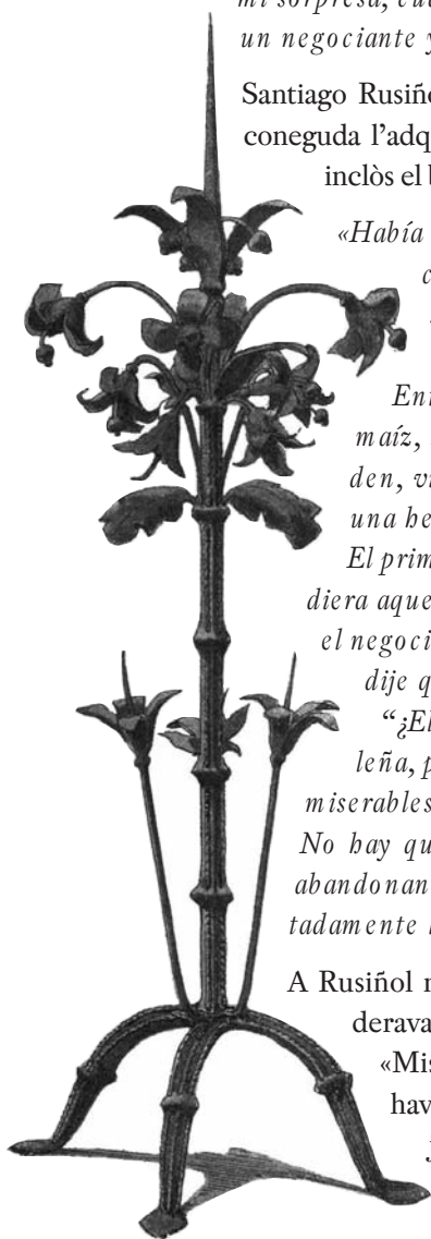
Fig. 5. Canelobre de peu de Santa Maria de Serrateix. MCFS 30962.

«Hubo a quien compré una veleta del año mil setecientos, que no pudiendo restaurarla de otro modo, borró del siete la parte superior y lo convirtió en un cuatro, es decir, con un toque de buril, estafóme nada menos que tres siglos.» 43