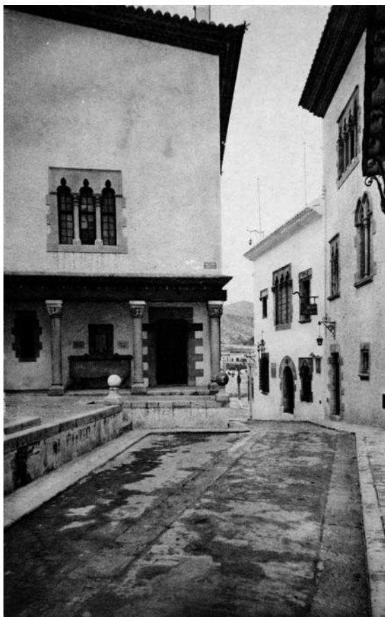
Fig. 7. El Cau Ferrat de Sitges, al final del costat dret del carrer.

L'ambient de colleccionisme d'objectes de ferro que es respirava al Cau Ferrat sitgetà influí en el veí Palau Maricel, encarregat pel multimilionari nord-americà Charles Deering a Miquel Utrillo, l'any 1910. Utrillo aconsellà a Deering que comprés el balcó de ferro forjat d'una casa de Santa Coloma de Queralt i l'instal·lés a la façana del Palau Maricel de Mar que dona al carrer del Fonollar. 65 Es tracta d'una peça esplèndida que porta la data del 1760 en una cartel·la i incorpora la típica grua en forma de drac, que esdevindria amb el temps un dels símbols més reconeguts del Cau Ferrat. L'any 1918, quan es posà a la venda el fons històric de l'antic Gremi de Serrallers de Barcelona, Utrillo aconsellà a Dee-