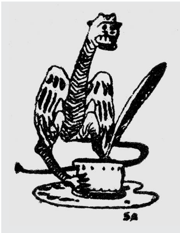
Fig. 6. Ex-libris de Santiago Rusiñol, estretament relacionat amb el seu gust pels ferros antics. c. 1894. MCFS 32100.

El 20 de febrer del mateix any, Rusiñol comprà a Andreu Massot «una lámpara de hierro antigua» que no hem pogut identificar. 55