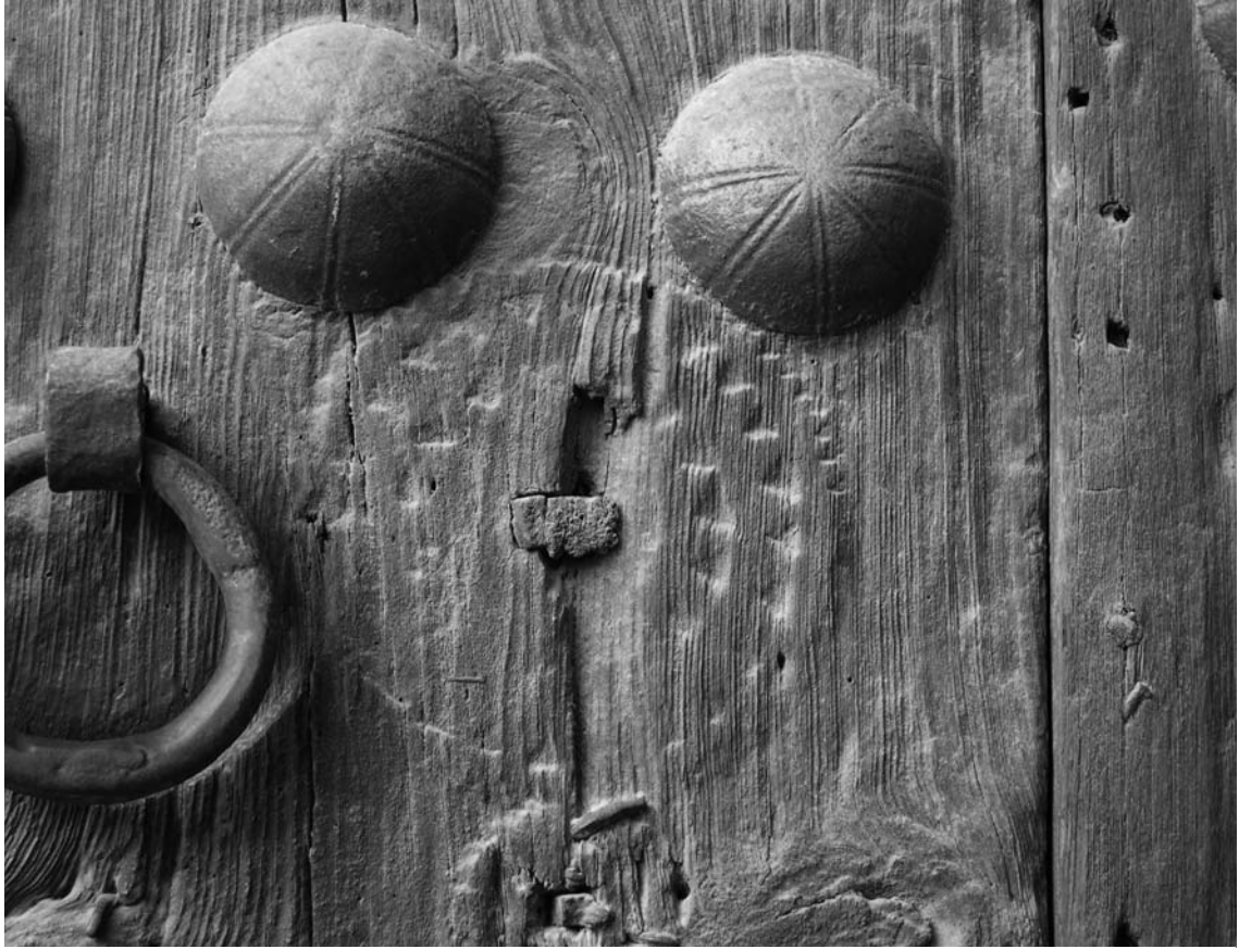
Fig. 2. Empremta conservada en la porta de l'església del monestir de Sant Cugat del Vallès.

tradicional associació entre la placa calada i la rosassa del monestir, no disposem de cap dada objectiva que ens permeti relacionar el picaporta amb núm. inv. 31518 i el monestir vallesenc.