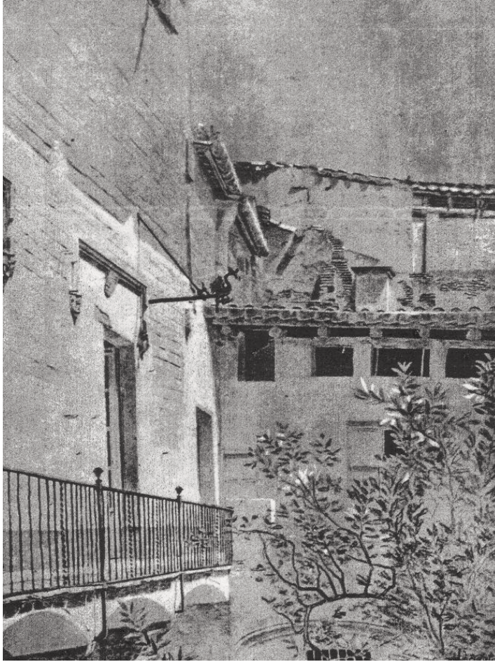
Fig. 4. Façana de la Casa de l'Ardiaca. Barcelona, 1869.

tangut a la Col·legiata de Sant Vicenç de Cardona (MCFS 31908). 38 Miquel Utrillo ens descriu amb detall com aconseguiren aquestes dues peces: