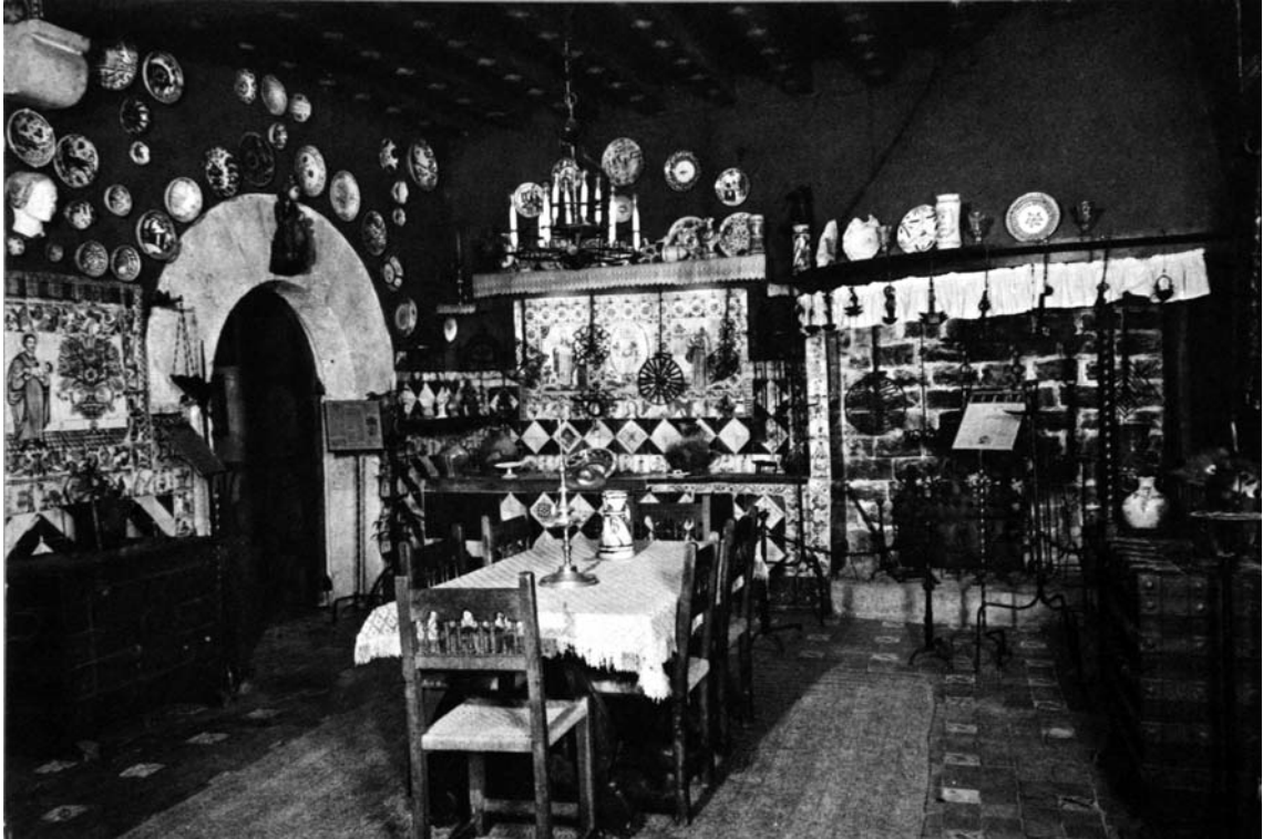
Fig. 9. Menjador i cuina del Cau Ferrat, en què destaquen objectes de ferro i ceràmica.

d'ornament— fins als elements més variats aplicats a l'arquitectura —balcons, reixes, grues, tornapuntes, penells, picaportes, panys, tiradors, claus ornamentals... 68