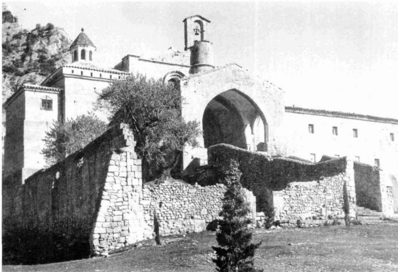
Figura 1. Vista frontal del Convent de Sant Salvador en la dècada dels anys 60.

Al terme d'Orta, a dos quilòmetres del seu casc urbà, hi ha el convent franciscà de Santa Maria dels Àngels (figura 1). El seu origen és un temple que data de finals del s. XIII o primers del