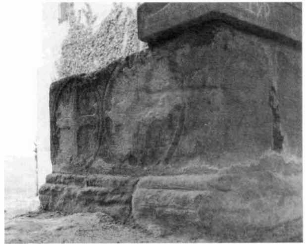
Figura IV. Sarcòfag (B). Fotografia de la banda esquerra. Detall de les dues creus esculpides en cercle.

Els càtars segons els breus testimonis que tenim conviurien pacíficament amb la població autòctona d'Orta, segurament convertits al catolicisme almenys formalment, i exercint els seus oficis; i no dubtem que desenvoluparien una destacada activitat econòmica que l'Orde del Temple aprofitaria en una zona dedicada de manera quasi exclusiva a l'agricultura i la ramaderia.