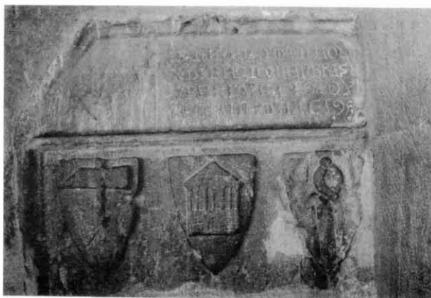
Figura III. Sarcòfag (C). Escuts gremials i/o d'oficis.

El contingent de persones vingudes des de l'altra banda dels Pirineus havia de tenir un gran protagonisme a la nostra zona, ajudant al seu repoblament i desenvolupant els seus oficis menestrals com els de teixidors, pastors, picapedrers, escultors, ferrers, fusters, 11 etc. I no van tenir dificultats per a integrar-se en aquesta