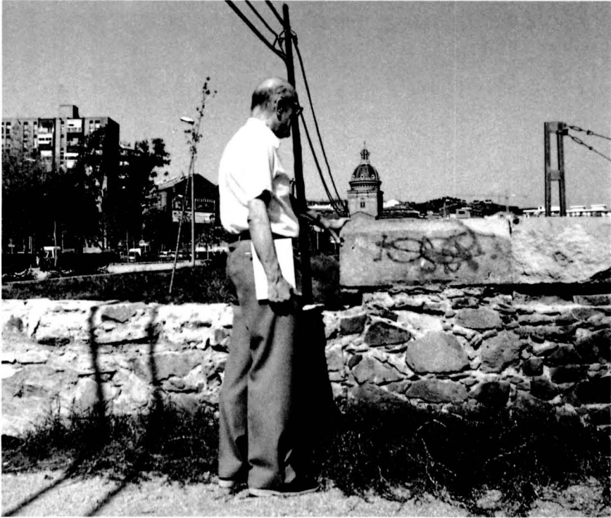
Resta del mur de contenció del Torrent d'Estadella construït l'any 1854, que no té l'alçada recomanada pel Sr. Antoni Rovira i Trias. Exp. 8-1852 i 2-1854. Tema: Ferrocarrils .

pías necesarias. Del modo como intentan verificarlos, haciendo el conducto con tubos de hierro colado y de un pie de diámetro poco más o menos, será imposible poder penetrar por ellos y por lo mismo más imposible de poder hacer ningún género de limpieas, quedando de este modo más de una vez obstruidos y por consiguiente privados de agua los propietarios de los terrenos.