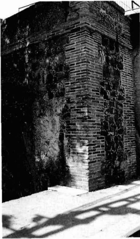
Croquis i fotografia d'un dels diversos sifons construïts per a passar l'aigua del Rec per dessota de la rasa del ferrocarril de França. Croquis original d'Antoni Rovira i Trias. Exp. 8-1852 i 2-1856. Tema: Ferrocarrils.